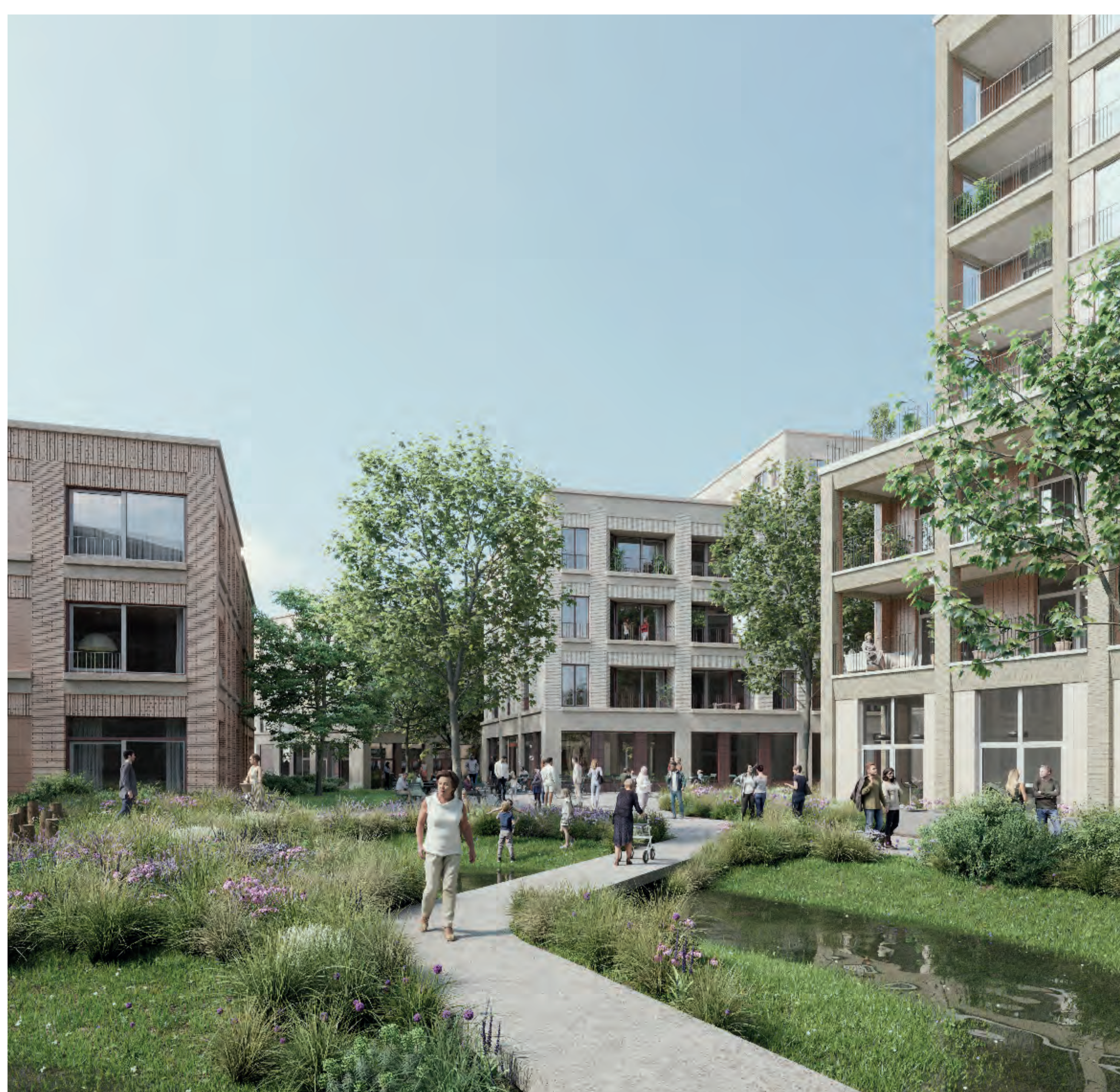
Zwartzustersvest: toekomstbeeld © CAAAP, OSAR & Org, VK

We realiseren ook nog eens levendige ontmoetingsplekken zoals een koffiebar, wasbar en brasserie. We zorgen ervoor dat jong en oud opnieuw samenkomt in deze levendige buurt.