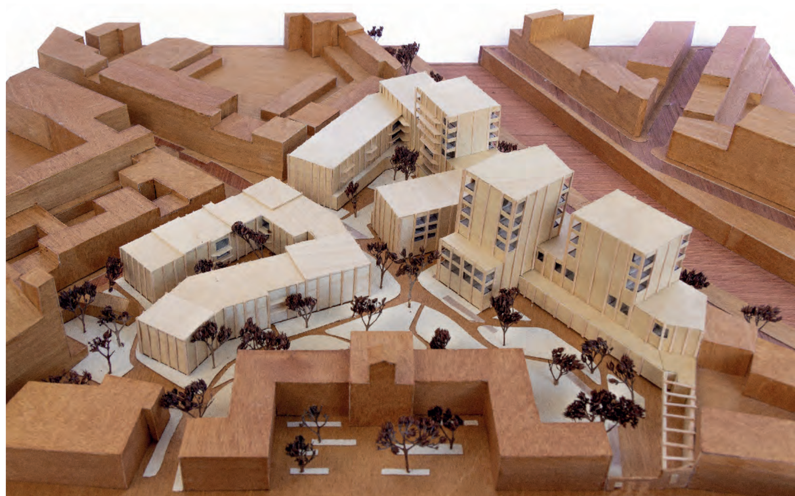
Zwartzustersvest: maquette toekomst © CAAAP, OSAR & Org, VK

Voor deze mix aan functies stelden we één bouwteam aan, die zowel het ontwerp als de bouw op zich zal nemen. Het gaat om de tijdelijke Maatschap CAAAP + Artes Roegiers + Artes Depret + Artes Projects .