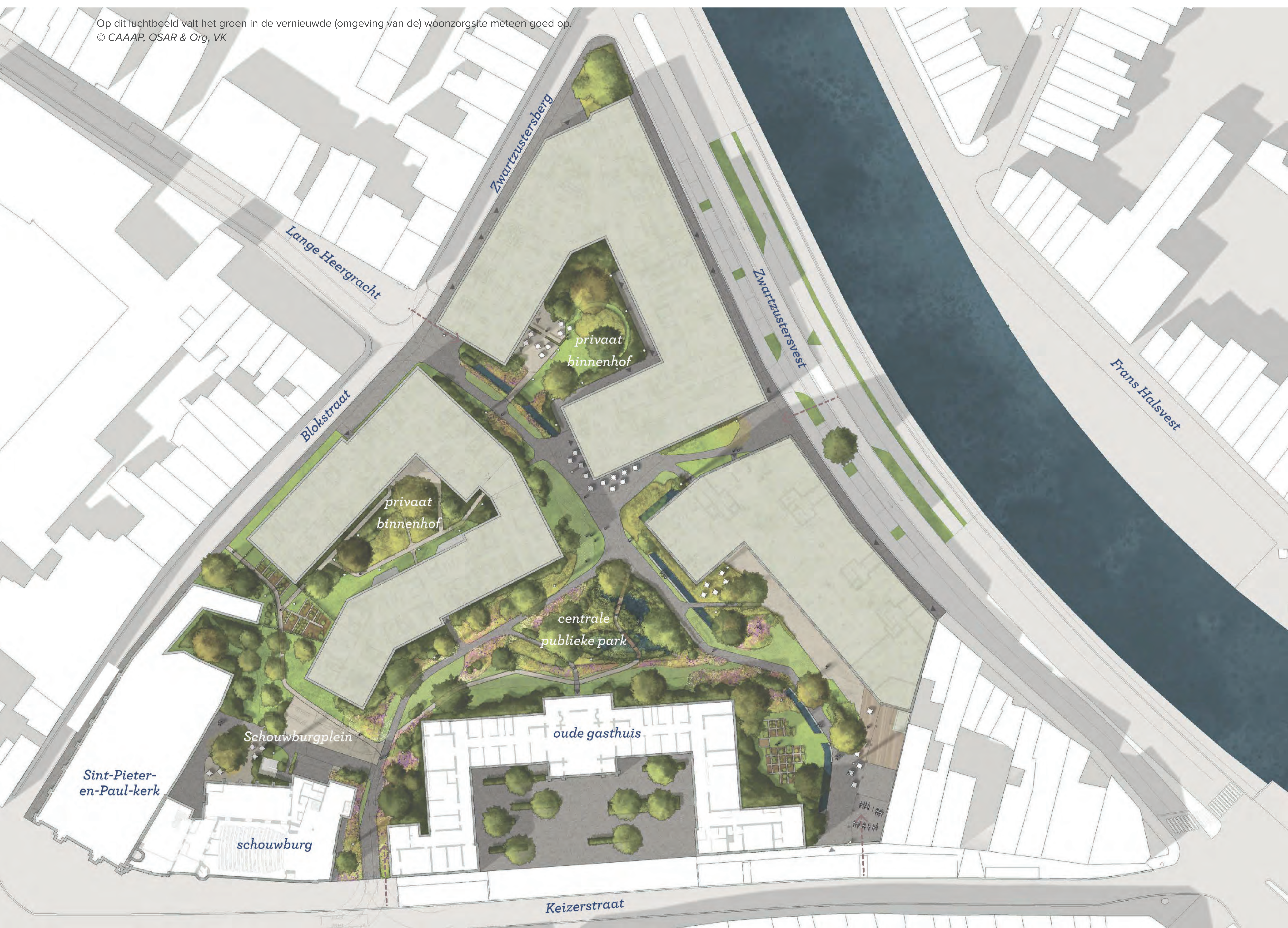
Op dit luchtbeeld valt het groen in de vernieuwde (omgeving van de) woonzorgsite meteen goed op. © CAAAP, OSAR & Org, VK

Ten slotte zetten we in op traag verkeer zoals voetgangers en fietsers. Tussen de gebouwen zal je geen gemotoriseerd verkeer zien. De ondergrondse parking rij je in via de vesten.