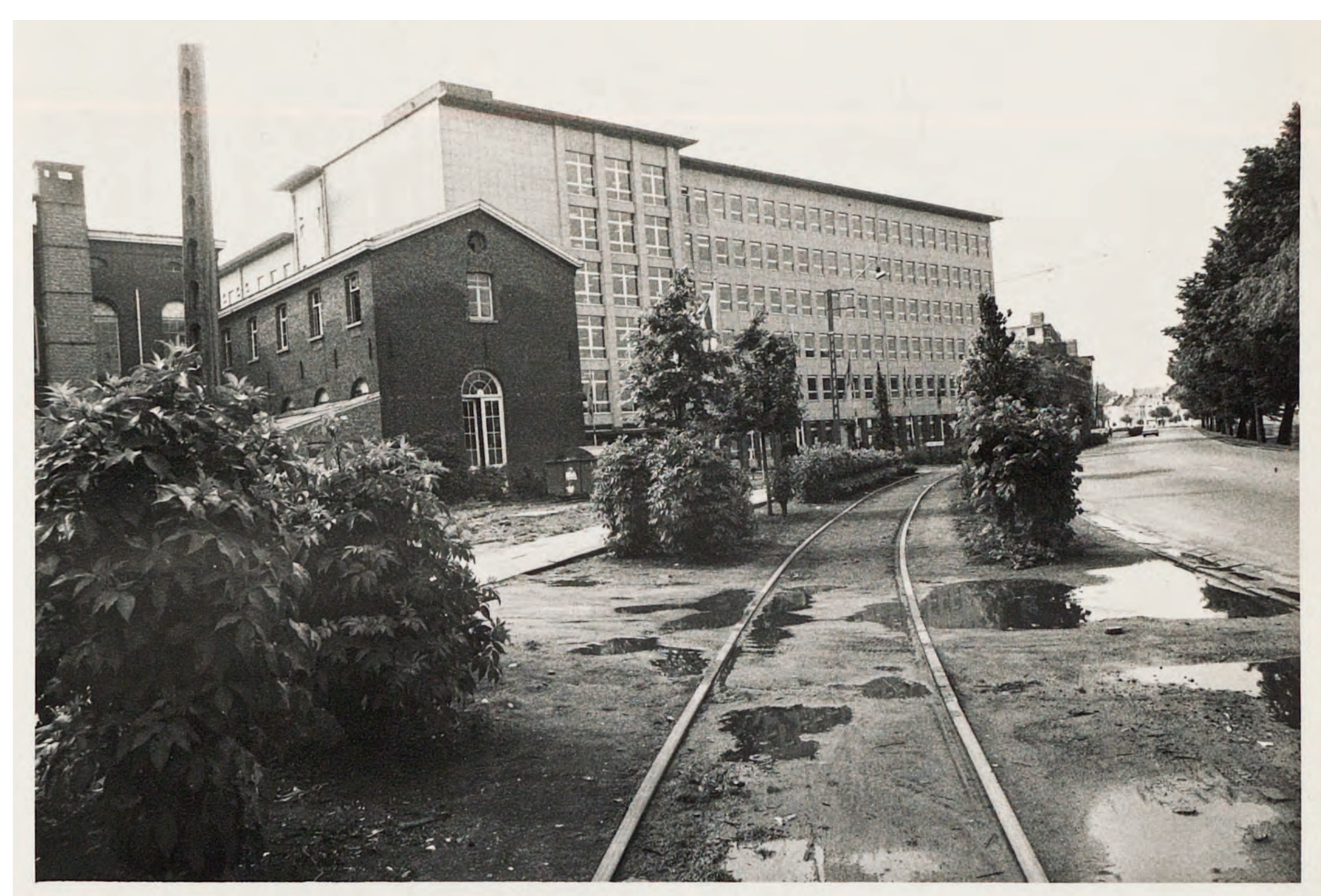
Zwartzustersvest, voorzijde van de nieuwe vleugel van het Stedelijk Gasthuis, 1973

Een groot gedeelte van het negentiende-eeuwse ziekenhuis moest in de jaren '70 en '90 plaats maken voor een nieuw, modern ziekenhuis . Hierdoor blijft enkel nog de U-vormige vleugel aan de Keizerstraat met centraal gelegen kapel over van het originele gebouw.