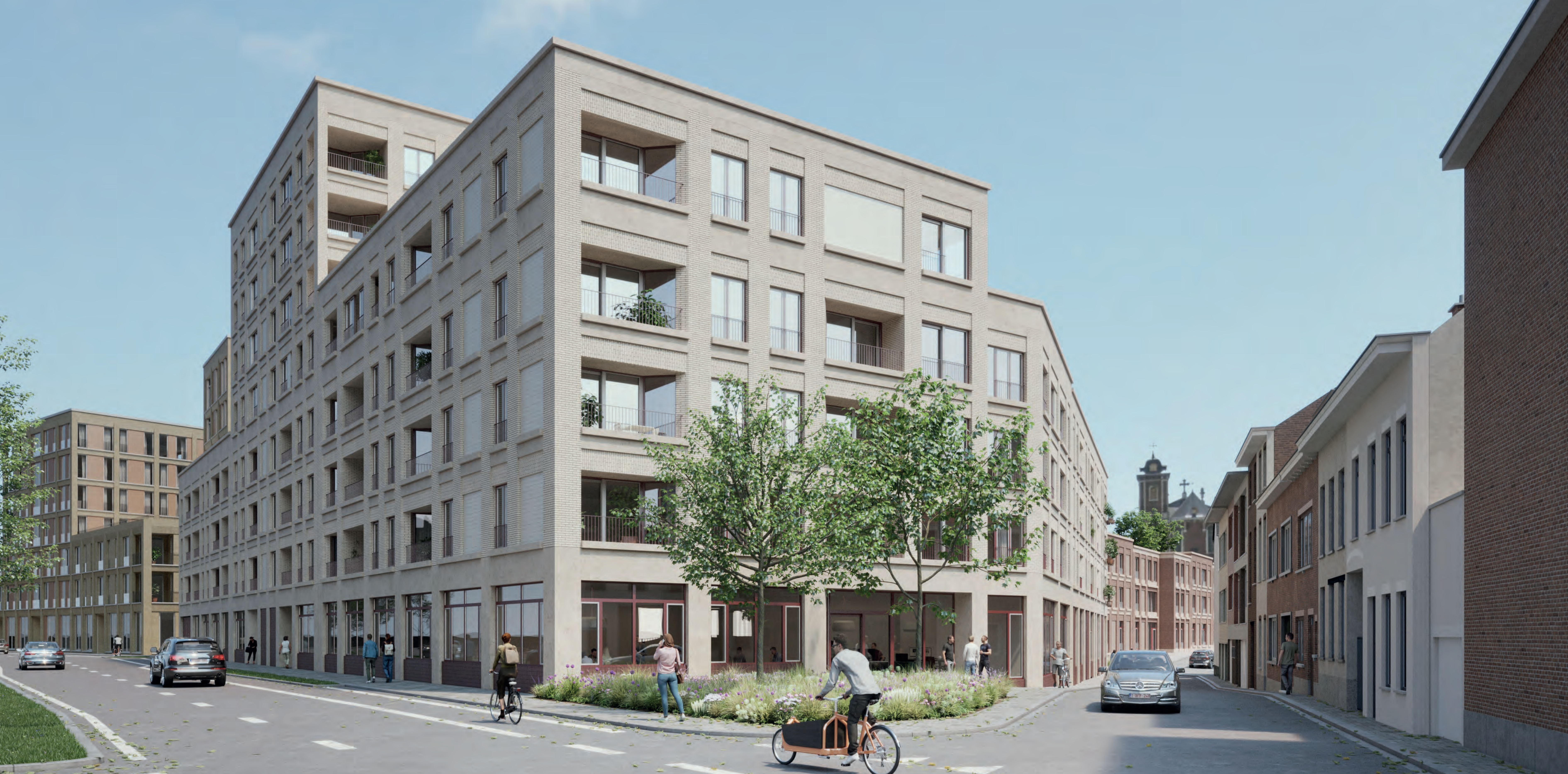
Zwartzustersvest: toekomstbeeld. Dit toekomstbeeld houdt geen rekening met het ontwerp van De Nieuwe Vesten. © CAAAP, OSAR & Org, VK