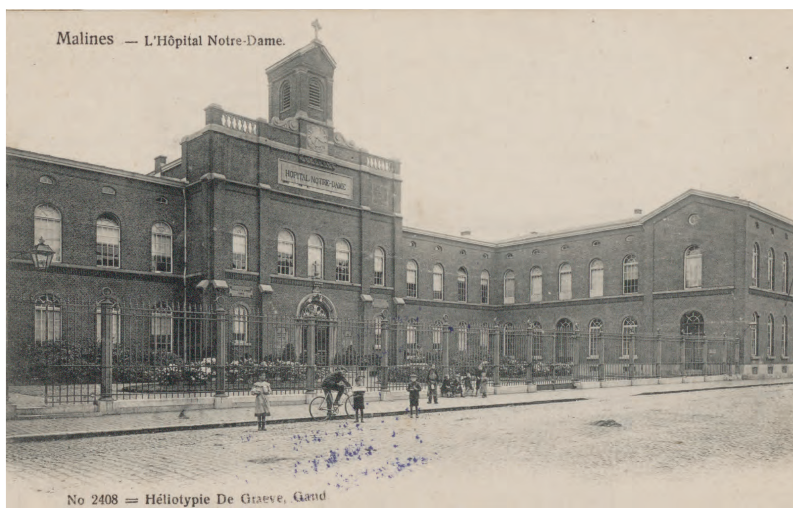
Prentbriefkaart van het Onze-Lieve-Vrouweziekenhuis aan de Keizerstraat