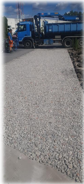
Aanleg brandweg Douaneplein