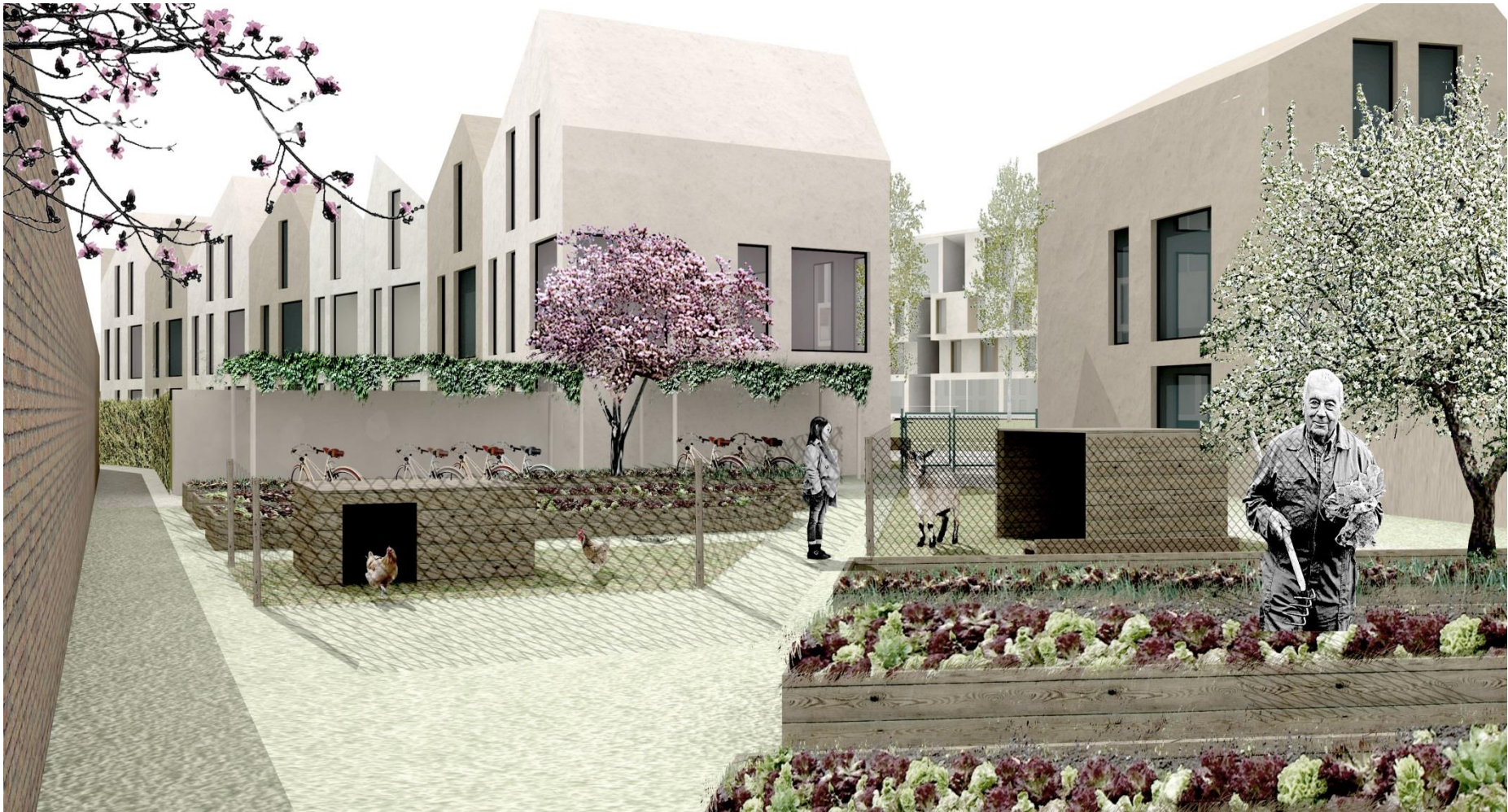
Zicht op tuinpad – BUUR cvba