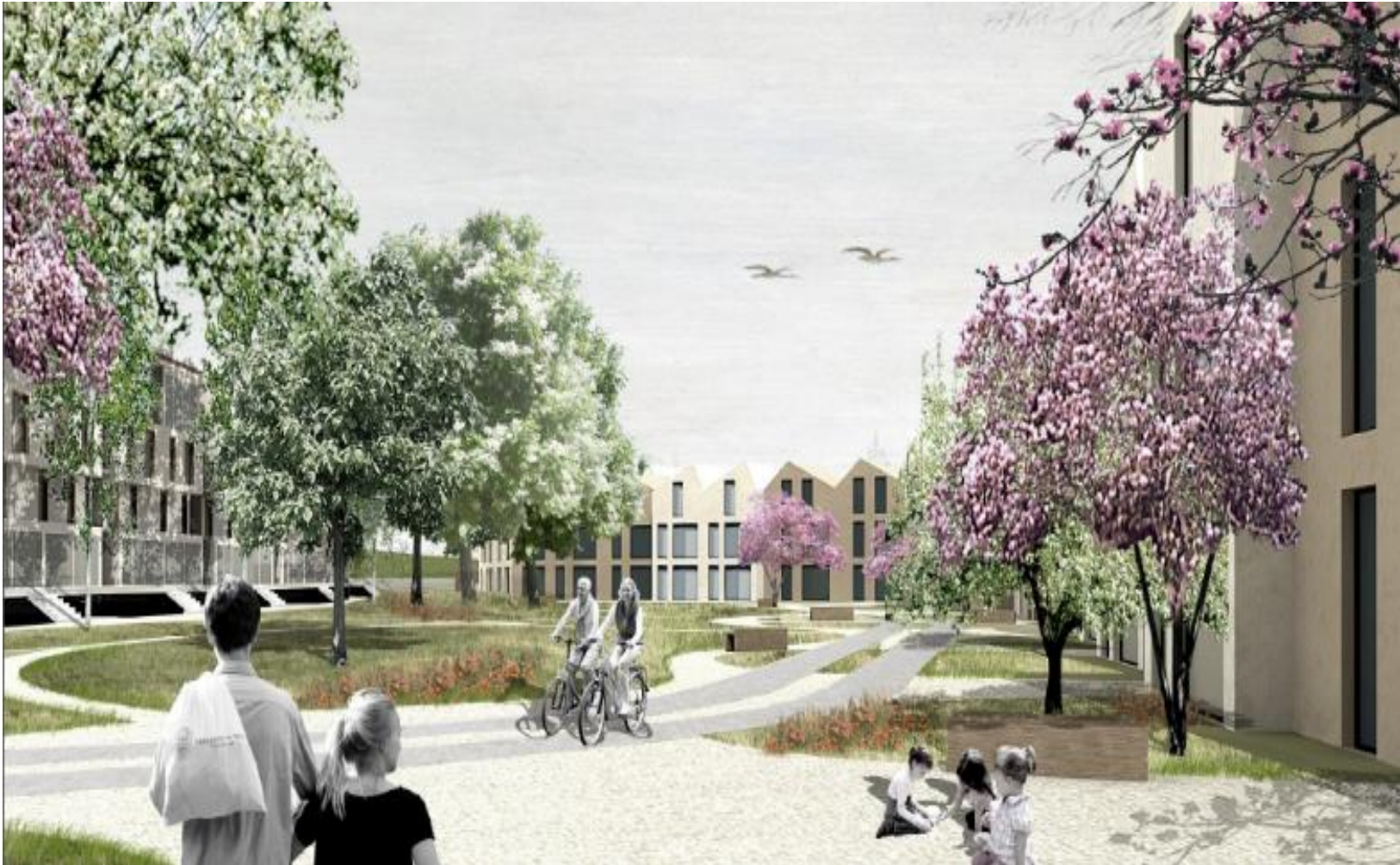
Zicht op park en eengezinswoningen – BUUR cvba