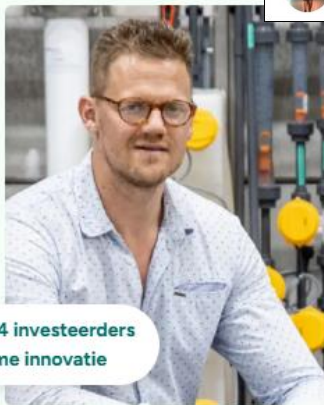
BOSAQ vond 114 investeerders voor duurzame innovatie