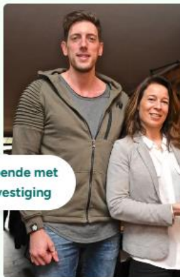
Mister Spaghetti opende met €115.000 haar 6e vestiging