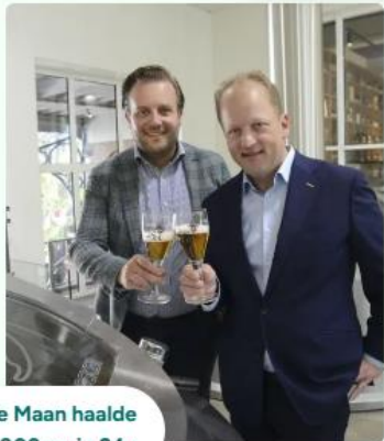
alve Maan haalde 00.000 op in 24u