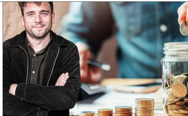
Balls & Glory lanceert crowdfunding voor nieuw restaurant