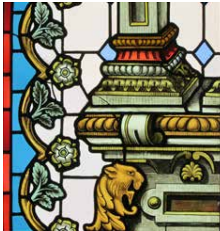
Detail van een gebrandschilderd glas-in-loodraam vóór (links) en na (rechts) restauratie.

voorzien in 2017 - zal ten slotte de laatste fase van de buitenrestauratie van start gaan.