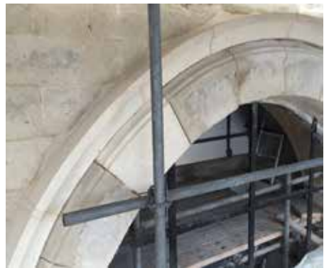
Dit detail van een gerestaureerde vensteropening toont de combinatie van nieuwe natuursteen (witte tint) met behouden natuursteen, die met restauratiemortel werd bijgewerkt (grijze tint).

vlotte afvoer van regenwater vormt daarbij een belangrijk criterium. Speciale aandacht gaat naar de voluutvormige steunberen van het kerkschip. Waterinfiltratie, vorst en plantengroei maakten dat de parementen ervan bol kwamen te staan, zodat zeker de lage delen van de steunberen gedemonteerd en hermitseld moeten worden. Voorts wordt ook al het voegwerk grondig gecontroleerd en waar nodig vervangen met een gepaste kalkmortel.