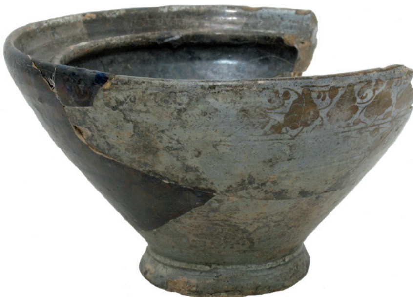
Kom in Valenciaanse majolica

schaaltje met vergulding en zwarte lijntekening en een zogenaamde tazza, een ondiepe drinkschaal) zijn deze laatstgenoemde stukken nogmaals een bewijs van de hogere sociale status van de bewoners.