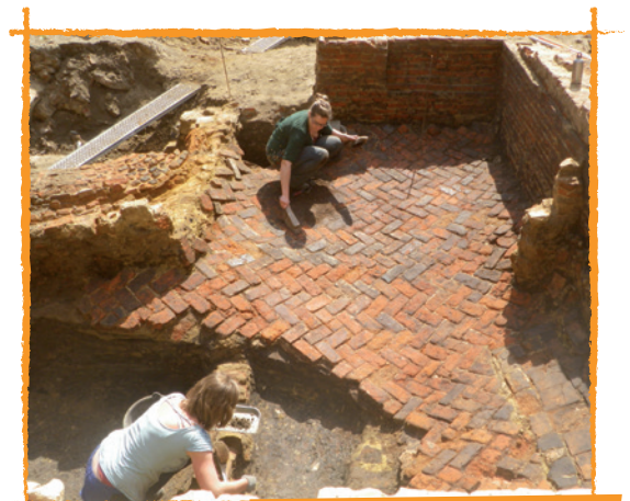
Oude bakstenen vloer en haard

Op de hoek van de Scheerstraat en de Frederik de Merodestraat werd afgelopen voorjaar na de afbraak van enkele bouwvallige panden een archeologisch onderzoek uitgevoerd. De stedelijke dienst Archeologie trof er laatmiddeleeuwse huizen aan. In een ervan bleek een opvallende cirkelvormige structuur aanwezig. Al snel werd duidelijk dat we hier te maken hadden met de resten van een oven.