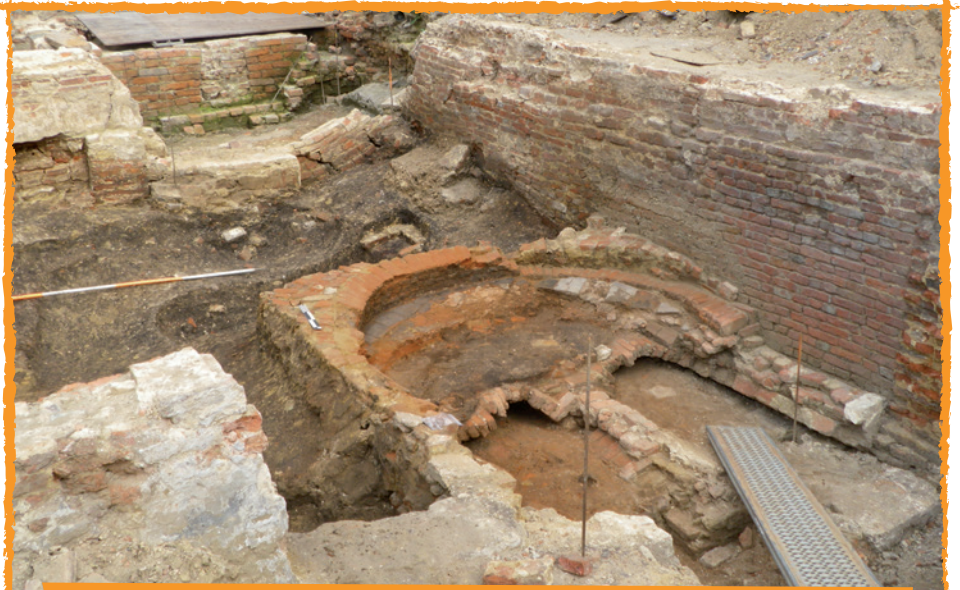
Zicht op de oven na het verwijderen van de koepel en een deel van de ovenvloer

Uit historisch onderzoek blijkt dat het huis met de oven in de tweede helft van de 16 de eeuw bewoond werd door twee bakkers. Bakker Rombout Verberct woonde er tot