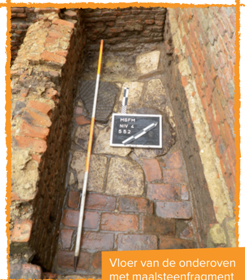
Vloer van de onderoven met maalsteenfragment