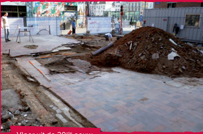
Vloer uit de 20 ste eeuw