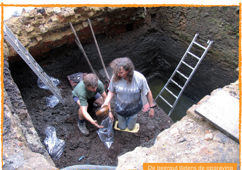
De beerput tijdens de opgraving

De beerput raakte in verschillende fases opgevuld. Tussen twee opvullingsfases vond telkens een ruiming plaats. Net als de septische putten van vandaag moesten de