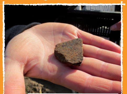
Wandscherf met kamversiering

we gerust stellen dat het een belangrijke site betreft. Een andere belangrijke site, aan het Zennegat, kreeg op 3 oktober als eerste in Mechelen de status van beschermde archeologische zone.