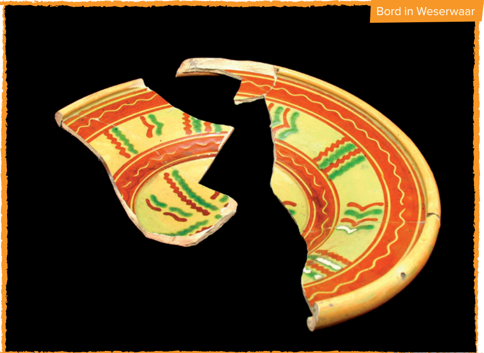
Bord in Weserwaar

Het overgrote deel van het rood en grijs aardewerk mag waarschijnlijk als lokale productie beschouwd worden. Mechelen kende immers zonder twijfel een lange traditie van pottenbakkers. Daarnaast werd ook geïmporteerd aardewerk aangetroffen. Uit het midden van de 16 de eeuw dateren enkele mooi gedecoreerde borden die geïdentificeerd kunnen worden als zogenaamde Weser- en Frechenwaar.