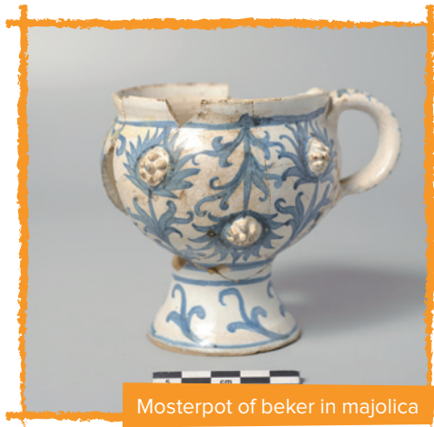
Mosterdpot of beker in majolica

nen, al is de kans groot dat – aangezien het om een zeldzaam stuk gaat – de kom eerder een pronkstuk was dat ergens in huis tentoongesteld stond. Een tweede interessant stuk, eveneens in majolica, is mogelijk afkomstig uit Italië. Over de functie bestaat nog discussie. Volgens de ene is het een beker, volgens de andere een mosterdpot. Tot hiertoe werden er nog geen parallellen gevonden. Het lijkt dus echt om een uitzonderlijk stuk te gaan! Samen met de zeer fraaie collectie holglas die eveneens uit de beerput werd opgediept (onder andere een aantal kelkglazen, een knobbelbeker met vergulde braamnoppen, een melkglazen