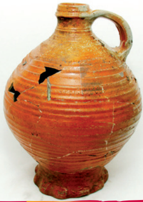
Steengoed kan uit Langerwehe