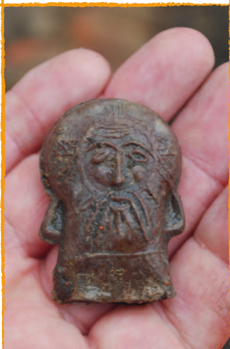
Pelgrimsampul uit de middeleeuwse beerputten