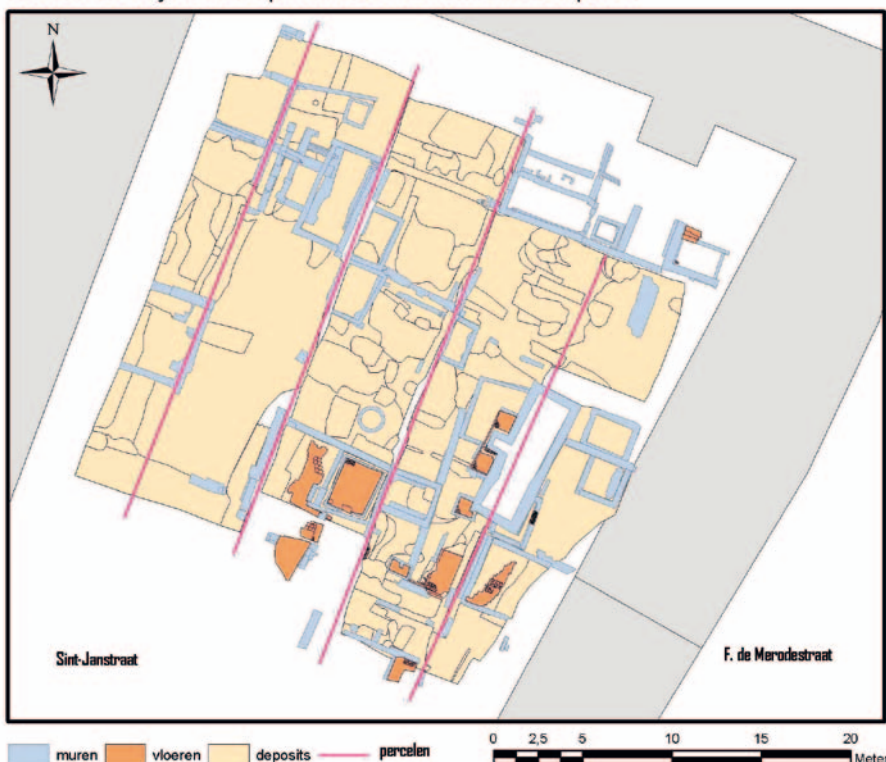
Hof van Busleyden: compilatie van de voornaamste sporen

Twee beerputten worden in verband gebracht met het Hof van Busleyden zelf. Hoewel ze fragmentarisch bewaard zijn, krijgen we aan de hand van hun inhoud een goed idee van de welstand van de toenmalige bewoners. Ze bevatten onder meer heel wat fragmenten versierd glas en luxe aardewerk. Op basis van dit materiaal en ook een opmerkelijk groot aantal rekenpenningen kunnen we deze beerputten in de 16de eeuw dateren. De Mechelse Vereniging voor Stadsarcheologie vzw heeft zich geëngageerd voor de verdere verwerking van het vondstmateriaal. Met de resultaten hiervan en dankzij bijkomend natuurwetenschappelijk onderzoek zullen we in de toekomst het verhaal van het Hof van Busleyden nog verder kunnen aanvullen.