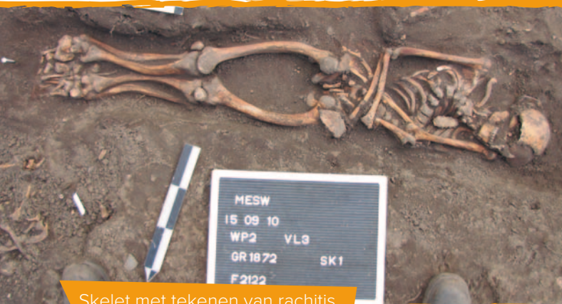
Skelet met tekenen van rachitis