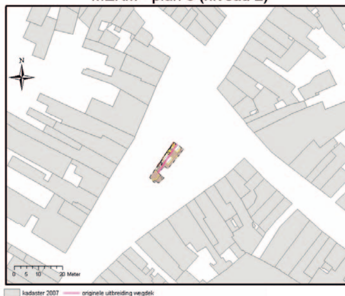
MEKM - plan 3 (niveau 2)

De weg en de kuilen zullen gede- teerd worden door middel van C14-onderzoek. De resultaten hiervan vind je in een volgende nieuwsbrief.