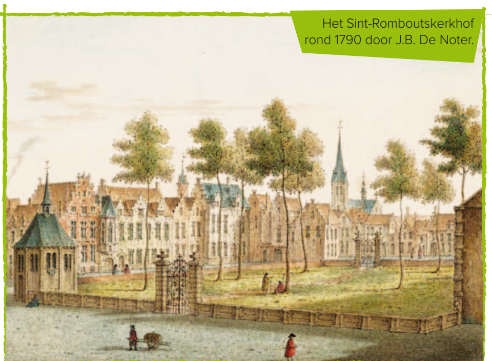
Het Sint-Romboutskerkhof rond 1790 door J.B. De Noter.

Maar het belang van de opgraving gaat nog verder. De archeologen lopen op deze opgraving immers de kans op het vinden van de oudste resten van de stad Mechelen: die van de abdij van Sint-Rombout. De oorsprong van deze abdij gaat minstens terug tot in de 9 de eeuw. Het was mogelijk op deze plek dat volgens de legende aan het einde van de 7 de eeuw de Ierse monnik Rumoldus leefde. De vele mirakels die aan hem werden toegedicht, leidden er toe dat rond zijn graf in de Sint-Romboutskapel, vermoedelijk omstreeks 775, een gemeenschap van monniken ontstond. Tussen 972 en 1008 werd deze gemeenschap