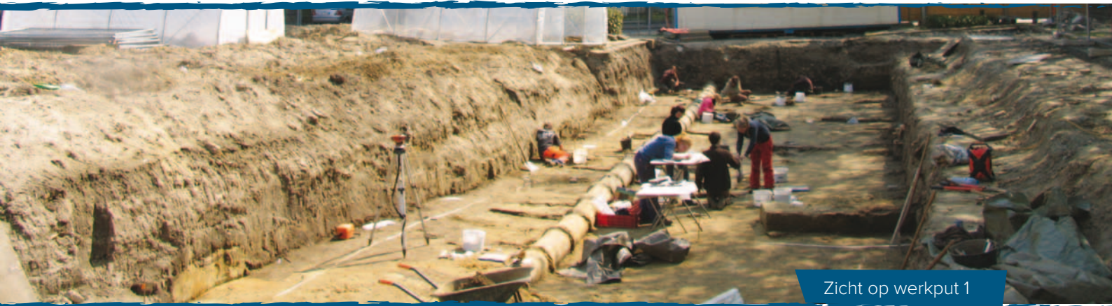
Zicht op werkput 1

door de Luikse prins-bisschop Notger omgevormd tot een kapittel van kanunniken. Het is mogelijk dat het kapittel werd gebouwd op de plaats van de voormalige abdij. De meeste bewoningssporen in het centrum van Mechelen gaan niet verder terug dan de 13 de eeuw. Sporen uit de 9 de eeuw zouden dus heel wat nieuwe inzichten kunnen opleveren over de stadsontwikkeling van Mechelen.