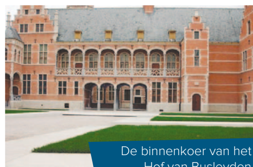
De binnenkoer van het Hof van Busleyden

Het lijkt wel alsof Mechelen stilaan één groot opgravingsterrein wordt. Ook de renovatie van het museum Hof van Busleyden (met nieuwe ondergrondse tentoonstellingsruimte ter hoogte van de binnenkoer) zal gepaard gaan met een archeologisch onderzoek. De opgraving door de stedelijke dienst Archeologie begint in mei en zal 5 maanden in beslag nemen. Het hof van Busleyden is genoemd naar zijn bouwheer, Jeronimus van Busleyden (ca. 1470-1517), lid van de Grote Raad van Mechelen, humanist en kunstverzamelaar. Busleyden kocht in 1505 gronden aan de St.-Jansstraat, voegde deze toe aan zijn eigendom aan de F. de Merodestraat en liet op deze gronden zijn stadspaleis optrekken. Onder de binnenkoer worden archeologische resten verwacht uit de periode 1250-1505.