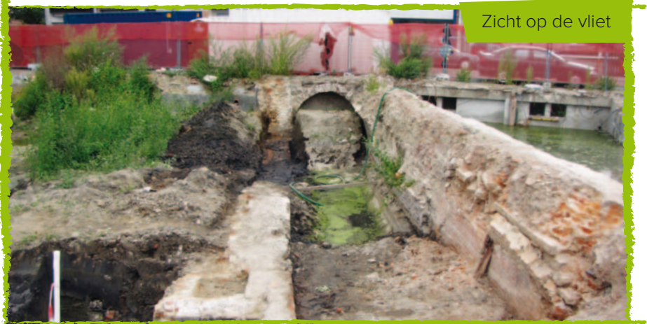
Zicht op de vliet

Op het onderste niveau van de opgraving werden resten gevonden van houten palen met ertussen kleinere gekliefde takken. Hiertussen was vermoedelijk een vlechtwerk van twijgen aangebracht. Wellicht waren dit erfafsluitingen. Op basis van de archeologische gegevens kunnen de resten gedateerd worden rond 1250 of iets vroeger. Een staal van de twijgjes ligt momenteel voor C14-datering op het Koninklijk Instituut voor het Kunstpatrimonium (KIK). Dat dergelijke fragiele resten meer dan 800