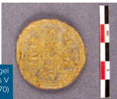
Het pauselijke zegel of bulla van Urbanus V (1362-1370)

De archeologen van AS hebben nog tot juni tijd om deze site te onderzoeken.