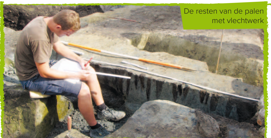
De resten van de palen met vlechtwerk

Terwijl op het terrein de funderingen worden uitgegraven voor de bouw van woonproject Het Clarenhof, gaat het onderzoek van de opgravingsgegevens achter de schermen gewoon verder. Want hoewel de opgraving erop zit, is het onderzoek van de vele goed bewaarde vondsten nog lang niet afgerond!