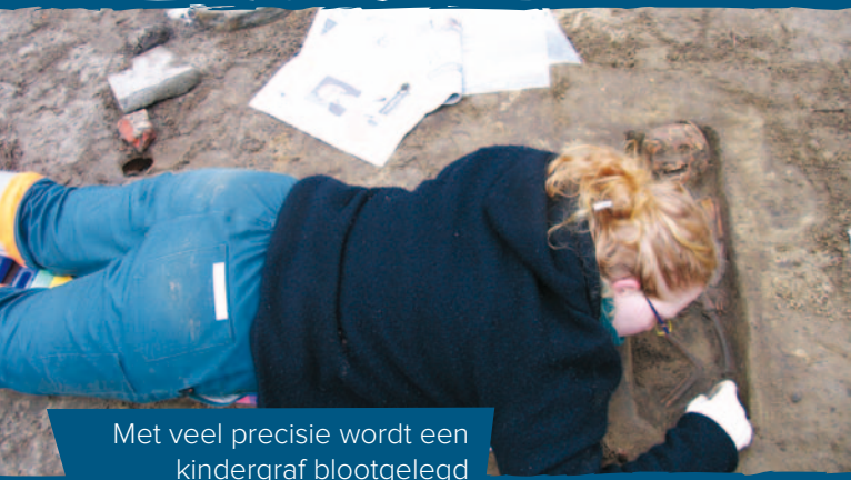
Met veel precisie wordt een kindergraf blootgelegd