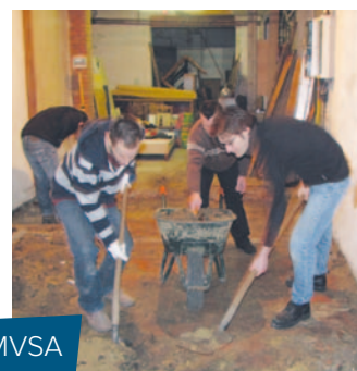
Vrijwilligers van MVSA aan het werk

Vrijwilligers die hun steentje willen bijdragen, kunnen zich aanmelden op info@mvsa.be .