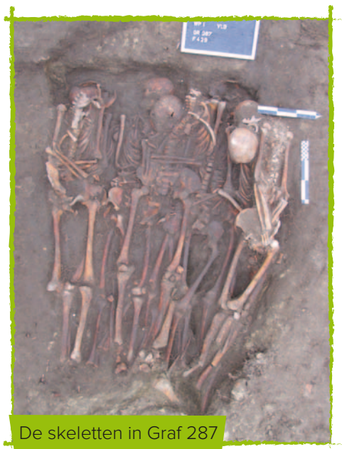
De skeletten in Graf 287

uit skeletten op en naast elkaar in verschillende richtingen. Er werd weinig of geen grond gevonden tussen de lichamen, waaruit blijkt dat de begravingen gelijktijdig waren of elkaar snel opvolgden. In het graf lagen 4 volwassenen. 2 van hen waren overduidelijk mannen, van de overige twee kon het geslacht niet met zekerheid bepaald worden. De overige 8 individuen waren adolescenten (12 tot 20 jaar). Bij adolescenten is geslachtsbepaling op basis van uiterlijke kenmerken niet mogelijk. Belangrijk om weten is dat dit de biologische leeftijd is en dat de leeftijdscategorieën waarin wij de skeletten onderverdelen niet noodzakelijk zo ervaren werden in middeleeuwen. Toen kon men al vroeger deelnemen aan het volwassen leven, als leerjongen, dienstmeisje, op het land, als