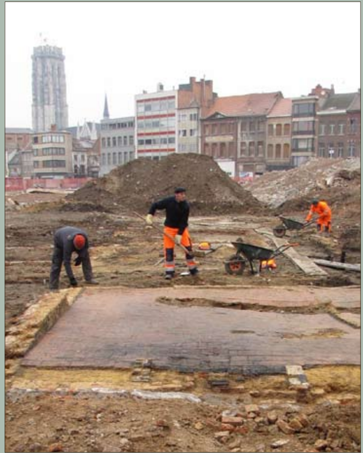
19de-eeuwse resten worden blootgelegd door archeologen

Leermarkt, Blaasbalgstraat, Huidenvettersstraat, ... Bij wie vertrouwd is met de oude ambachten zullen deze straatnamen ongetwijfeld een belle-tje doen rinkelen. 'Huidenvetters' is immers de middeleeuwse benaming voor leerlooiers, de ambachtslui die runderhuiden tot leder bewerkten. Rond 1250 woonden de leerlooiers bij mekaar naast de Melaan in de