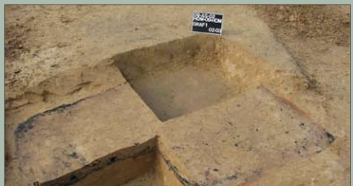
Eén van de crematiegraven wordt in kwadranten opgegraven