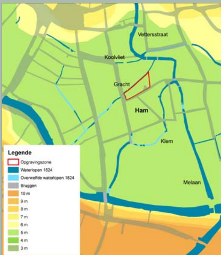
Situering van de wijk 'de Ham' in het lager gelegen deel van de stad

Rik Wouterstraat, die trouwens tot in de 19de eeuw Vetterstraat werd genoemd. In de loop van de 14de eeuw verhuisden de leerlooiers naar de wijk 'de Ham' (zie ook kaderstuk op p.5). Hoewel er vandaag geen water meer te bespeuren valt in de onmiddellijke nabijheid, betekent de benaming Ham 'land gelegen in een rivierbocht'. Waar die rivierbocht zich bevond, is nu niet meer duidelijk. Wat echter nog wel aantoonbaar is, is het laaggelegen grondniveau; de buurt ligt namelijk slechts tussen 5 en 6 m boven zeeniveau. Ook de vele vlietjes in de buurt wijzen erop dat het gebied oorspronkelijk erg drassig was. In 1291 is er zelfs sprake van 'het eiland in de Ham'. Waarschijnlijk gaat het om het terrein dat omsloten werd door twee armen van de vliet 'de Klem'.