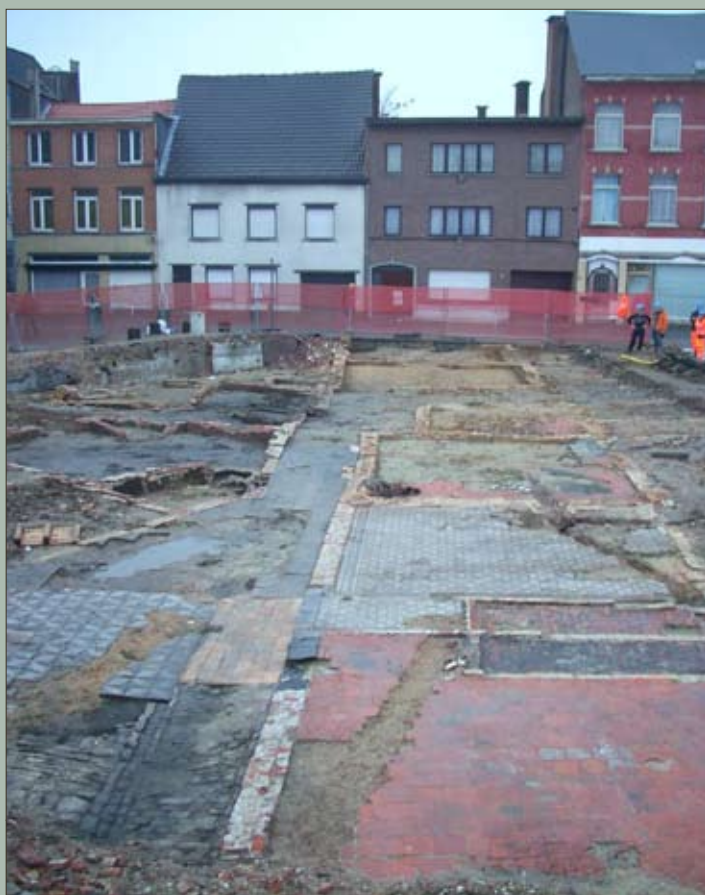
Zicht op het achtererf met de blootgelegde muur- en vloerresten van het fortje