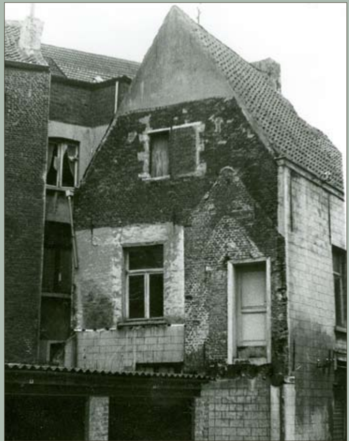
Huis in traditionele bak- en zandsteenstijl

Tot in 1973 stond ter hoogte van werkput 1 een huis in traditionele bak- en zandsteenstijl. Archeologisch onderzoek wees uit dat het gebouwd werd in de 16de eeuw. In de 19de eeuw werd op het achtererf van het huis een fortje aangelegd. Een smal paadje verschaftte toegang tot vier kleine huisjes. In de laag onder dit fortje, tegen de vliet aan, werd een interessante ontdekking gedaan. Hier werden enkele van de hieronder vermelde kalkputten aangetroffen; het eerste bewijs dat de bewoners inderdaad leerlooiers waren! Het grote 16de-eeuwse huis bleek een bakstenen voorloper te hebben, die in de loop van de 14de eeuw gebouwd werd. En we kunnen nog verder terug in de tijd. Tijdens de late 13de eeuw stond er op deze plaats een huis waarvan het muurwerk uit zeer grote bakstenen bestond, kloostermoppen genaamd. Dit pand was op zijn beurt de opvolger van een huis dat vermoedelijk uit hout was gebouwd. Van dit 'oudste' huis werden voorlopig enkel vloeren in aangestampte leem teruggevonden. Het vervolg van het onderzoek levert hopelijk de grondplannen en de vroegste geschiedenis van deze woningen op.