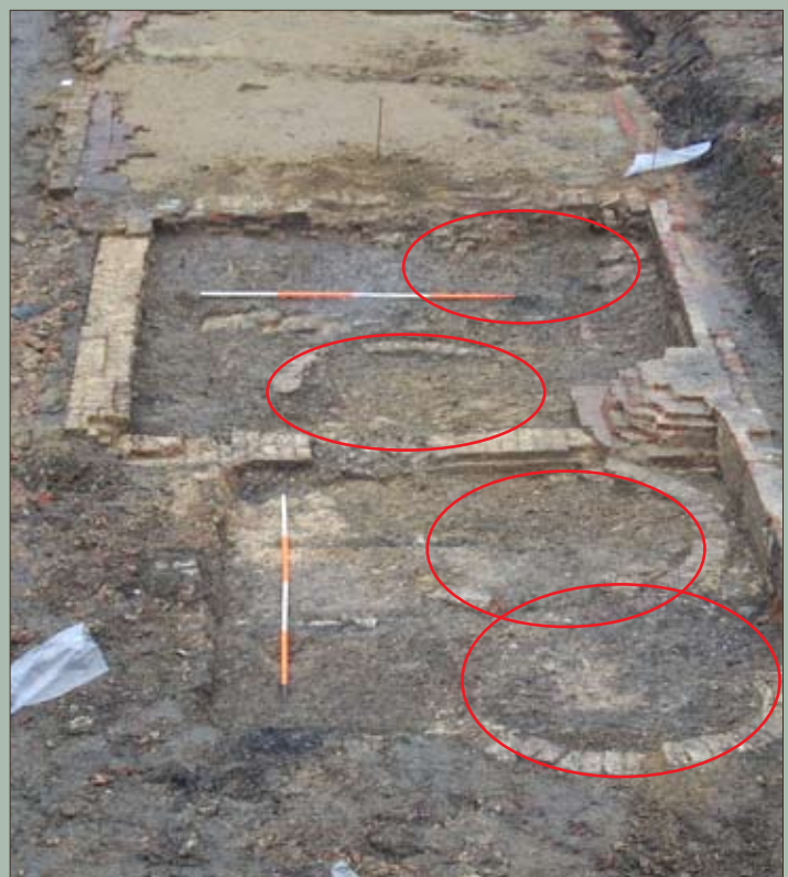
Zicht op de cirkelvormige bakstenen kalkputten

Niet enkel de kalkputten en de vliet zijn een aanwijzing dat het hier om een huidenvetterswijk gaat. Over de hele site verspreid worden hoornpitten en andere dierlijke botresten aangetroffen. De basisgrondstof voor het leder, runderhuiden, werd door de slaggers geleverd aan de leerlooiers met de hoornpitten nog aan de huiden vast. Op die manier kon men controleren of men geen huiden van honden of varkens gebruikte, wat volgens een reglement van 1382 verboden was. Naast het gebruik van runderhuiden was ook het gebruik van schapehuiden toegestaan.