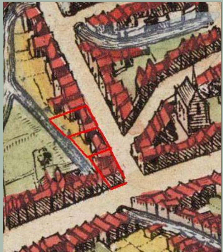
Situering van de werkputten in 16de-eeuwse context

Dat de huidenvetterswijk precies op deze plaats terug te vinden is, is geen verrassing en kan verklaard worden vanuit de praktijk. Om leer te looien ontdeedden de huidenvetters de huiden eerst van haar en vleesresten o.a. door ze te behandelen met ongebluste kalk in zogenaamde kalkputten. Daarna werden de huiden gewassen en in kuipen gelegd met gemalen eikenschors. Het looizuur uit de eikenschors kreeg dan vele maanden de tijd om in te werken op de huiden. Nadien werden de huiden opnieuw gewassen. De nabijheid van stromend water, in dit geval de vliet 'De Gracht', was dus geen overbodige luxe.