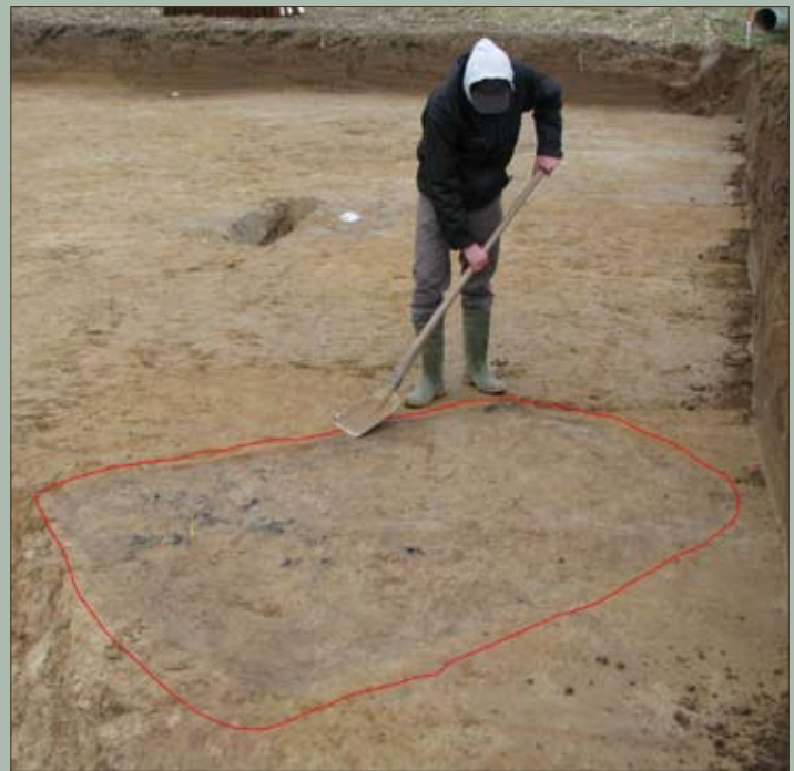
Een archeoloog van AS legt het eerste crematiegraf bloot

De Hombekerkouter in Hombeek maakt deel uit van een eeuwenoud akkercomplex dat zich uitstrekt tussen de kernen van Hombeek en Leest. De vruchtbare zandleembodem maakt dat het gebied al zéér lang in gebruik is als landbouwgrond. Op een terrein van ca. 0,25 ha werden onder meer twee rechthoekige kuilen aangetroffen, deels gevuld met houtskool. De wanden van de kuilen vertoonden sporen van brand. Vermoedelijk