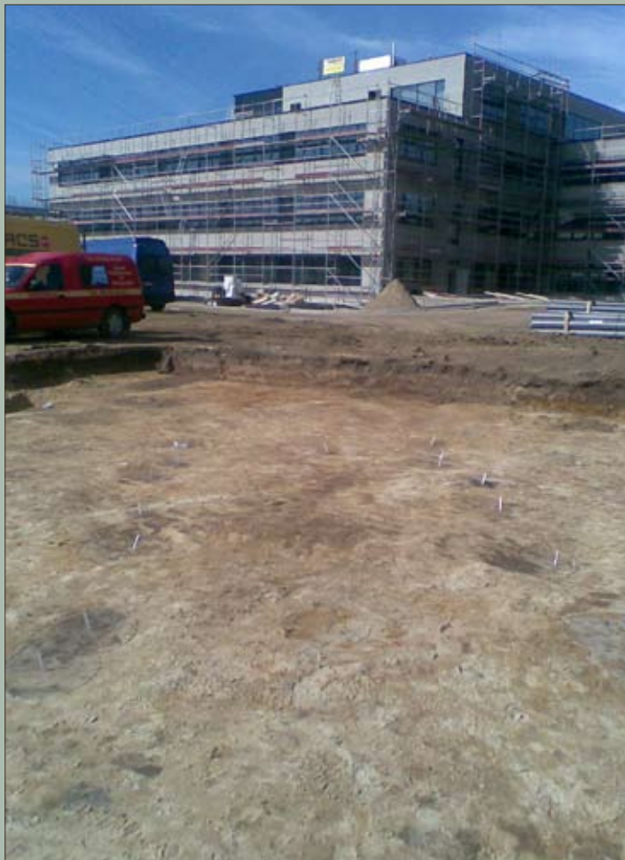
Paalsporen van een éénschepige constructie uit de ijzertijd