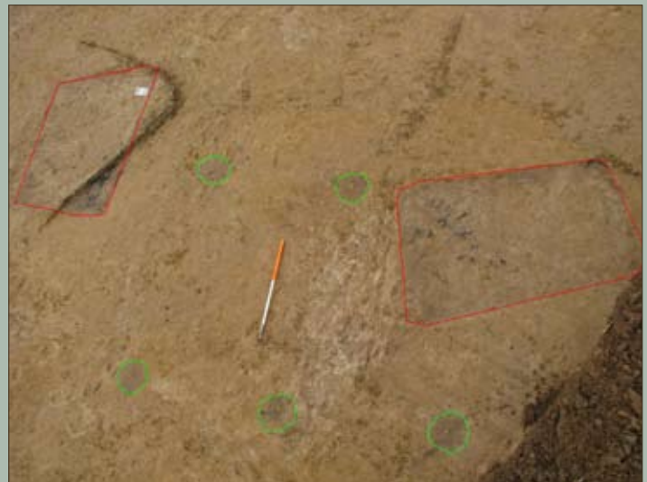
De twee vermoedelijke crematiegraven en de paalsporen van een spieker

Spiekers zijn gebouwtjes met vier of zes palen die vermoedelijk dienst deden als opslagplaats voor graan en andere akkervruchten. Wil je weten hoe zo'n spieker er uit zag, verbind de bolletjes in de juiste volgorde met elkaar.