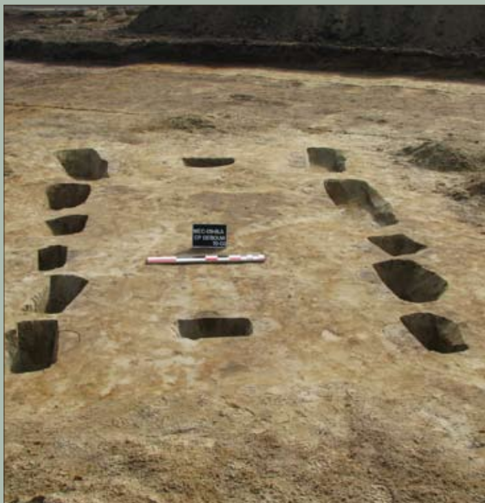
De gecoupeerde paalsporen

hebben we te maken met een paar crematiegraven uit de Romeinse tijd. De grote hoeveelheid houtskool en de rood verbrande wanden laten vermoeden dat de nog smeulende resten van de brandstapel in deze kuilen begraven werden. Deze denkpiste wordt ondersteund door gelijkaardige vondsten in de omgeving, bijvoorbeeld het brandrestengraf dat in 1939 op de site Warande-Den Berg in Leest werd aangetroffen. Een tweede hypothese verklaart de kuilen als meilers, kuilen die gebruikt werden voor het stoken van houtskool voor huishoudelijk of industrieel gebruik. Verder onderzoek naar de inhoud van deze kuilen zal mogelijk uitsluitel geven. Verder werden op het terrein ook enkele leemextractiekuilen en paalsporen gevonden. Deze konden met behulp van enkele scherven in de ijzertijd (750–57 v.C.) gedateerd worden. Aan de hand van enkele paalsporen kon het grondplan van een kleine éénschepige constructie, een zogenaamde spieker, gereconstrueerd worden. De resten van het bijhorende woonhuis moeten zich ergens in de buurt bevinden. Ook elders op de kouter worden nog nederzettingssporen verwacht.