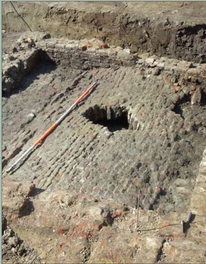
Het gewelf van de beerput van het bijgebouw langs de Huidevettersstraat