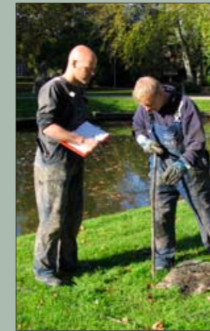
De onderzoekers van RAAP