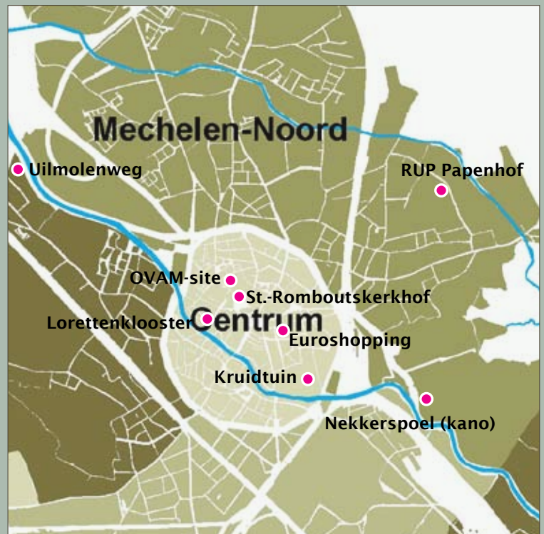
Overzicht van de sites die in deze nieuwsbrief aan bod komen