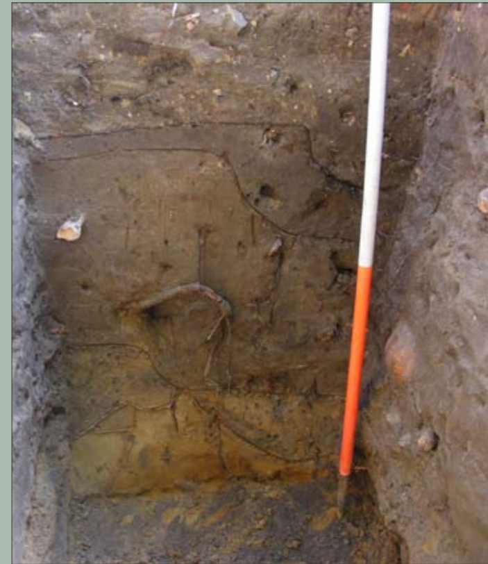
De profielwand van proefsleuf 2

In een eerste proefsleufje, ter hoogte van huis Concordia, werden geen begravingen aangetroffen. Hier bevinden we ons dus buiten het kerkhof. Dit wil echter niet zeggen dat er niets te vinden is. Onder een dun pakket verstoorde grond werden verschillende archeologisch interessante lagen aangetroffen. Het totale pakket met archeologische sporen bleek nog minstens 1,50 m dik en bevatte onder meer een afvalkuil met materiaal uit de 13de eeuw.