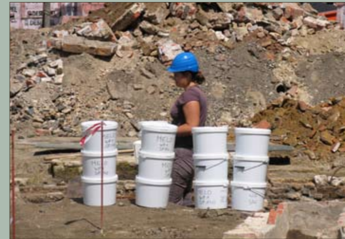
Stagiaires nemen zeefstalen van een beerput