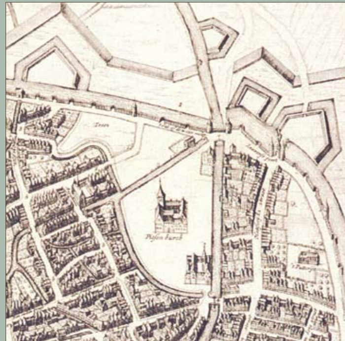
Pitzemburg en omgeving volgens Blaeu (1649)

Keijers, D., 2008. Kruidtuin in Mechelen, Stad Mechelen; archeologisch vooronderzoek: bureauonderzoek, verkennend booronderzoek en geofysisch onderzoek . RAAP-rapport 1664. RAAP Archeologisch Adviesbureau, Amsterdam.