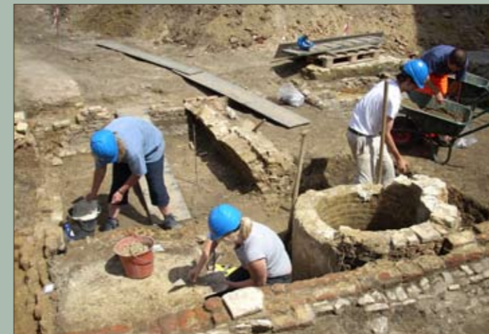
Achtererf van één van de huizen ten zuiden van 't Sweert