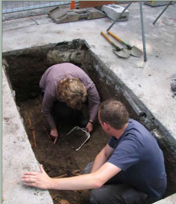
Proefsleuf 2 op het Sint-Romboutskerkhof

Bij plannen voor de heraanleg van het huidige plein dient rekening gehouden te worden met dit kwetsbare erfgoed. Het plein situeert zich bovenop één van de oudste en belangrijkste plaatsen van Mechelen. Natuurlijk stelt zich dan de vraag hoe goed de archeologische gegevens in de bodem bewaard gebleven zijn. Misschien is er bij de heraanleg van het plein in de jaren 1950 al veel vernield, of bij de afschaffing van het noorderkerkhof in 1785. Om op deze vraag een antwoord te vinden, maakte de stedelijke dienst Archeologie in juni 2008 twee kleine proefsleuven.