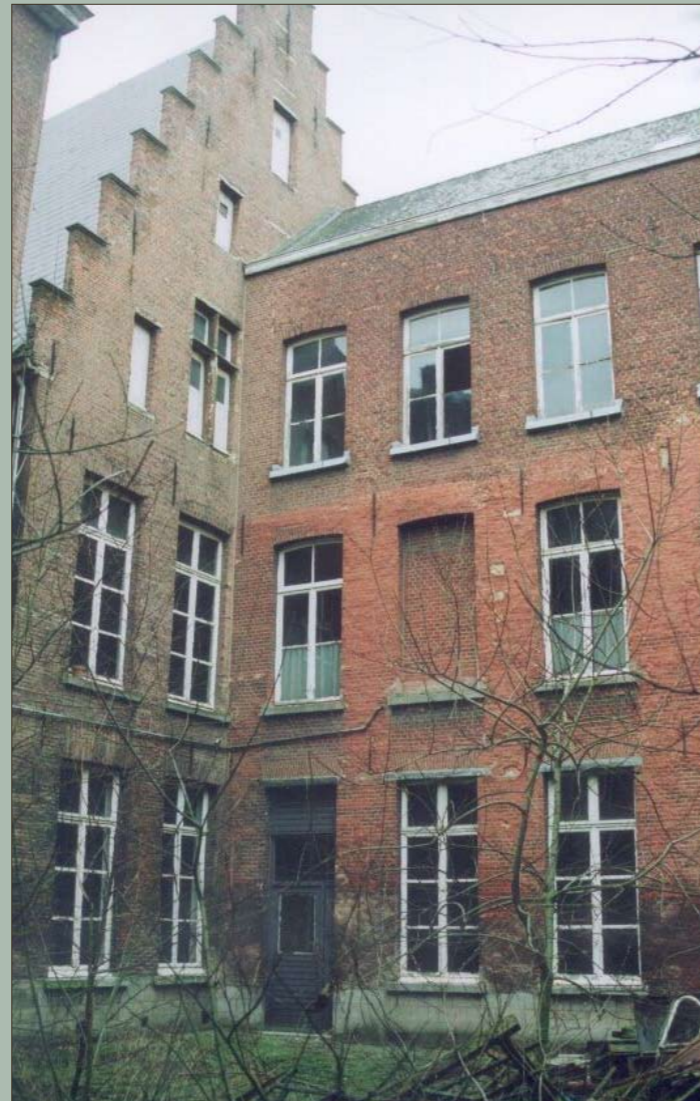
De achtergevel van het Hooghuis

Een bouwhistorisch onderzoek van het Hooghuis wees uit dat het gebouwd werd in de 16de eeuw. Bij het sloop van het poortgebouw van het klooster, dat tegen het Hooghuis was aangebouwd, kwam een deel van de bezetting van de zijgevel los waardoor een muur in Doornikse kalksteen zichtbaar werd. Het gebruik van dit bouw materiaal is in Mechelen eerder uitzonderlijk en wijst op een datering in de 13de eeuw of vroeger.