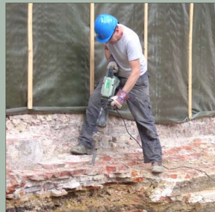
Afbraak van de 19de- en 18de-eeuwse resten door de archeologen

Ook het Hooghuis blijkt dus een veel oudere voorganger te hebben. Het gebouw wordt grondig gerenoveerd en het erf wordt archeologisch onderzocht. Dit onderzoek zal hopelijk uitwijzen welke functie het gebouw had en welke relatie er bestond was tussen het huis, het bijhorende erf en de Nieuwe Melaan.