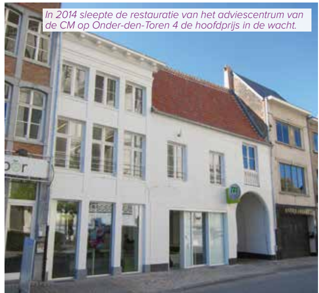
In 2014 sleepte de restauratie van het adviescentrum van de CM op Onder-den-Toren 4 de hoofdprijs in de wacht.

Ben jij trots op je werk? Schrijf je t.e.m. 31 oktober in! W www.mechelen.be/stedelijke-prijs-bouwkundig-erfgoed