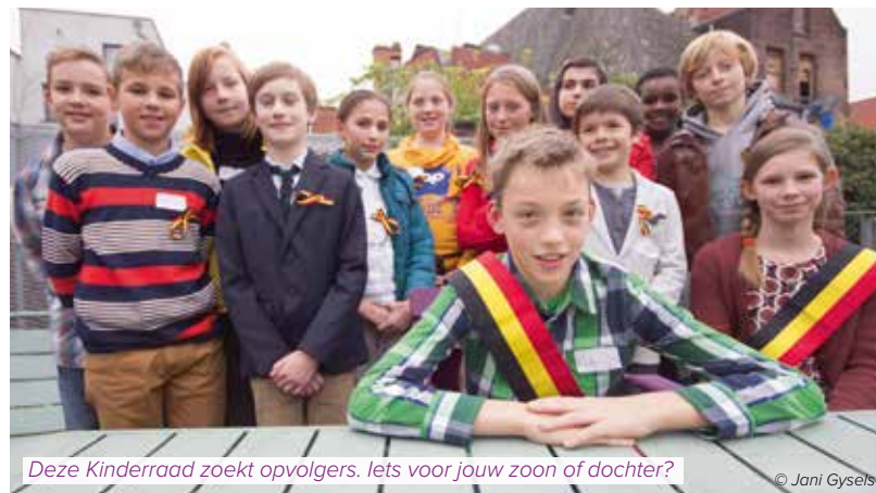
Deze Kinderraad zoekt opvolgers. Iets voor jouw zoon of dochter?