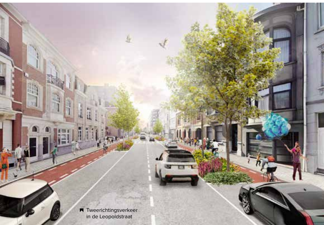
Tweerichtingsverkeer in de Leopoldstraat