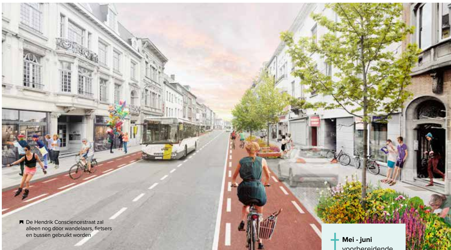
De Hendrik Consciencestraat zal alleen nog door wandelaars, fietsers en bussen gebruikt worden