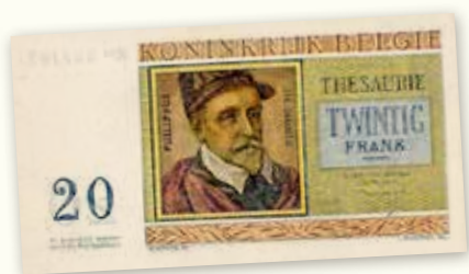
Philippus De Monte sierde jarenlang het Belgische briefje van twintig frank