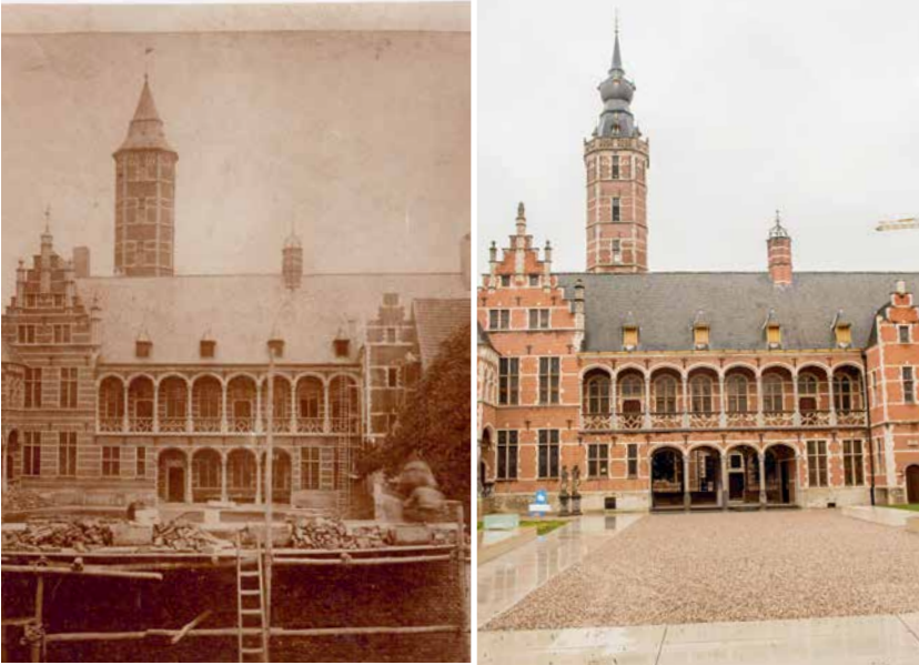
■ Het Hof van Busleyden in 1864 (tijdens renovatiewerken) en nu

Het Hof van Busleyden werd aanvankelijk gebouwd voor de humanist Hiëronymus van Busleyden. Antoon I en Rombout II Keldermans startten in 1503 aan de bouw. In 1619 richtte Wenceslas Cobergher er het pandjeshuis Berg van Barmhartigheid in. Mensen in geldnood konden er geld lenen in ruil voor een onderpand, bijvoorbeeld een zakhorloge of juwelen.