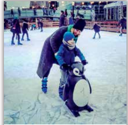
👤 savaway Er eindelijk op geraakt! #toobusyholidaying #schaatsboot #2800love #schaatsenopdedijle #meandmyboy #momandsontime #christmasholidays