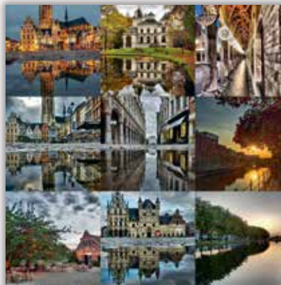
👤 mechelen_in_beeld Thx for all your likes and comments. ❤️ #2800love #mechelen #belgium #europe #bestnine2017 #VisitMechelen #CityScape