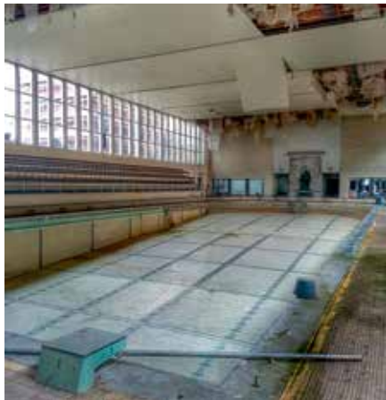
De oorspronkelijke zwemkom wordt een openluchtzwembad met een modern wellnesscomplex

Toch verdwijnt de oorspronkelijke functie van de ‘Ouwen Dok’ niet helemaal. Een moderne wellness, met openluchtzwembad centraal in het gebouw, wordt het