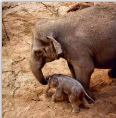
👤 planckendael Ons kerstkindje kreeg een naam 🥰 Jullie stemden voor de naam #Suki! Dit betekent 'geliefde' 🥰 #Planckendael #2800love