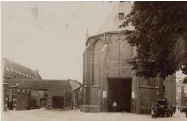
■ De voormalige Minderbroederskerk aan de Minderbroedersgang 5, rond 1940

De kerk van de minderbroeders, een mannelijke kloosterorde, dateert uit 1304. Twee keer werd de Minderbroederskerk heropgebouwd: na de grote stadsbrand van 1342 en na de Beeldenstorm van 1566, waarbij tal van kerken geplunderd en vernield werden.