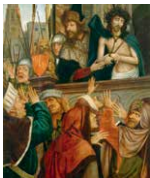
© Museu Nacional de Machado de Castro

Twijfel je nog om de tentoonstelling te bezoeken? Deze vier topstukken trekken je ongetwijfeld over de streep!