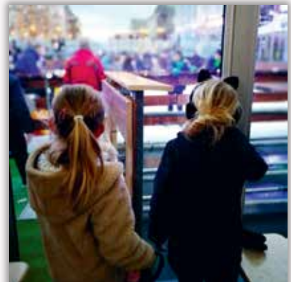
👤 ookatrienoo Happy girls #bff #ijspiste #2800love