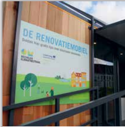
👤 thommmas Wij gaan binnenkort renoveren. Mechelen, kom maar op met die tips! #renovatiemobiel #mechelenklimaatneutraal #renoverenwiewildiekantleren #2800love

Jouw kans om iedereen te laten meegenieten van jouw unieke kijk op Mechelen en zijn Mechelaars.