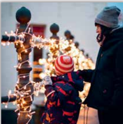
👤 roosjetseyen Zijn laatste Kerst als ons enigste kinneke Jezus, he's enjoying it 🥰 ❄️ #wijjook #christmastime #christmaslights #2800love