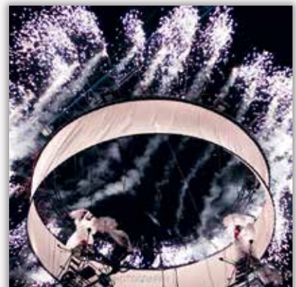
👤 kv.photography25 Dancing in the sky #Theater #TheaterTol #UitInMechelen #MechelenHoudtUeWarm #2800love #MechelenInVuurEnVlam