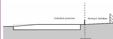
Figuur 1 Schets Afgewerkte pas collectieve groenzone