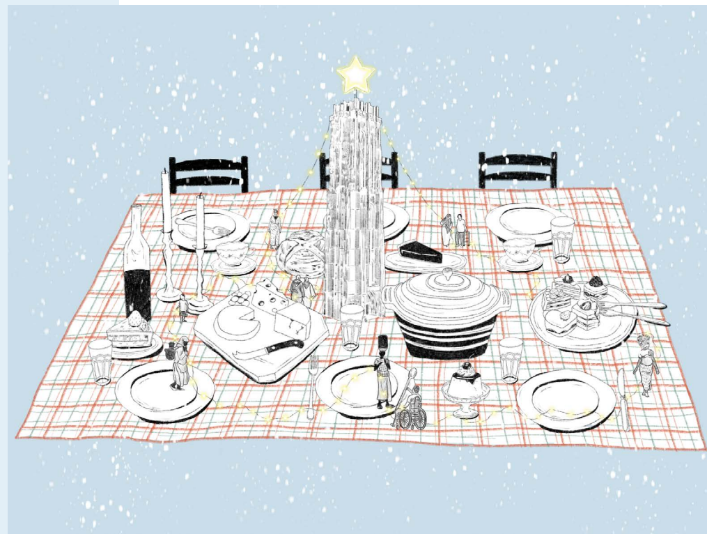
Illustratie: Astrid Staes

Circus Ronaldo (Frauke), Sint-Romboutskathedraal (Bram), Depot Rato (Famke, Erika, Elke), Museum Hof Van Busleyden (Siel), Stadsarchief Mechelen (Koen)