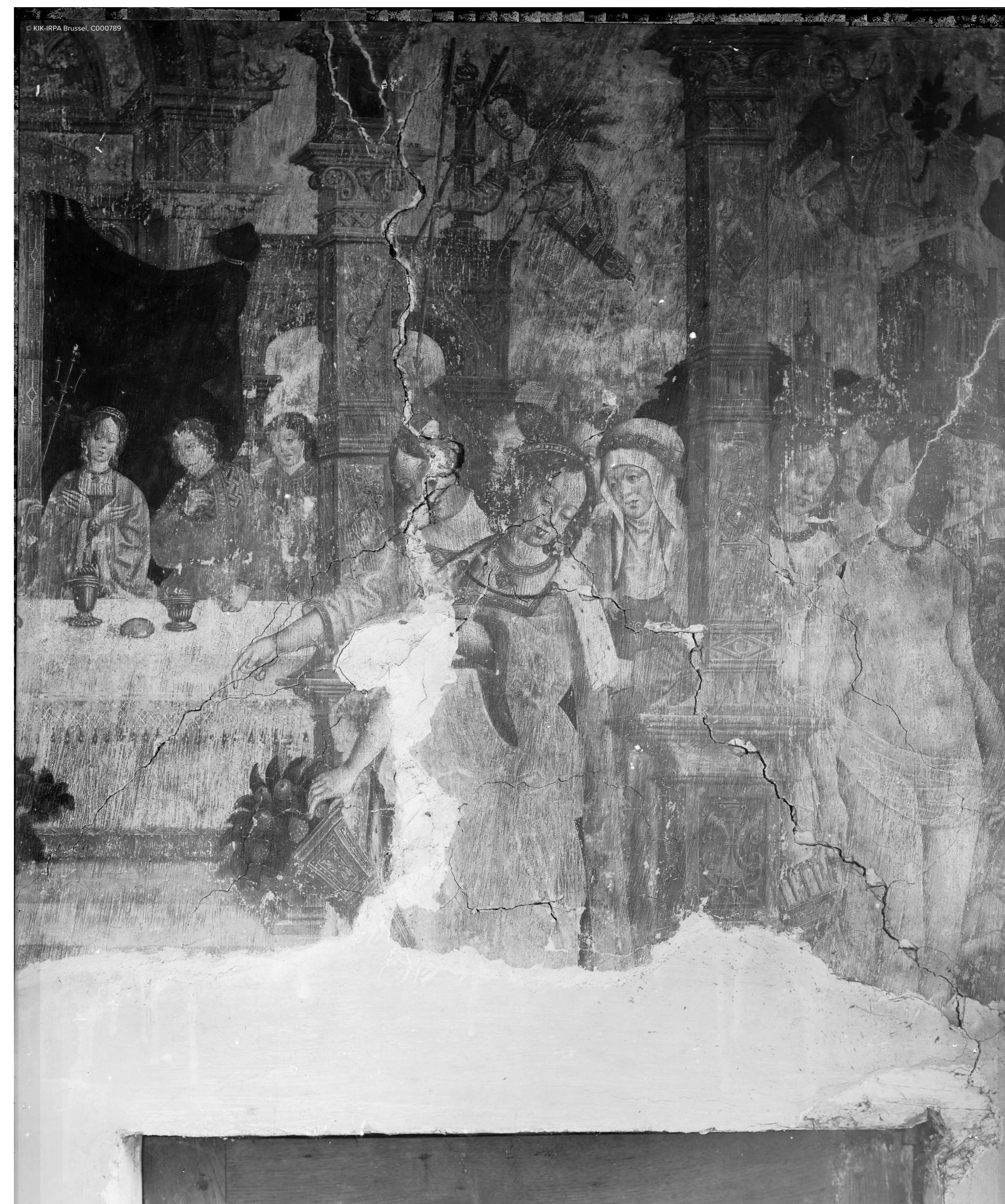
▲ detail uit de kwelling van Tantalus ca. 1900. Een detail dat enkele personages weergeeft die het tafereel eertijds bevolkten: een galant, zestiende eeuws gezelschap en de schaars geklede godin, Aphrodite.