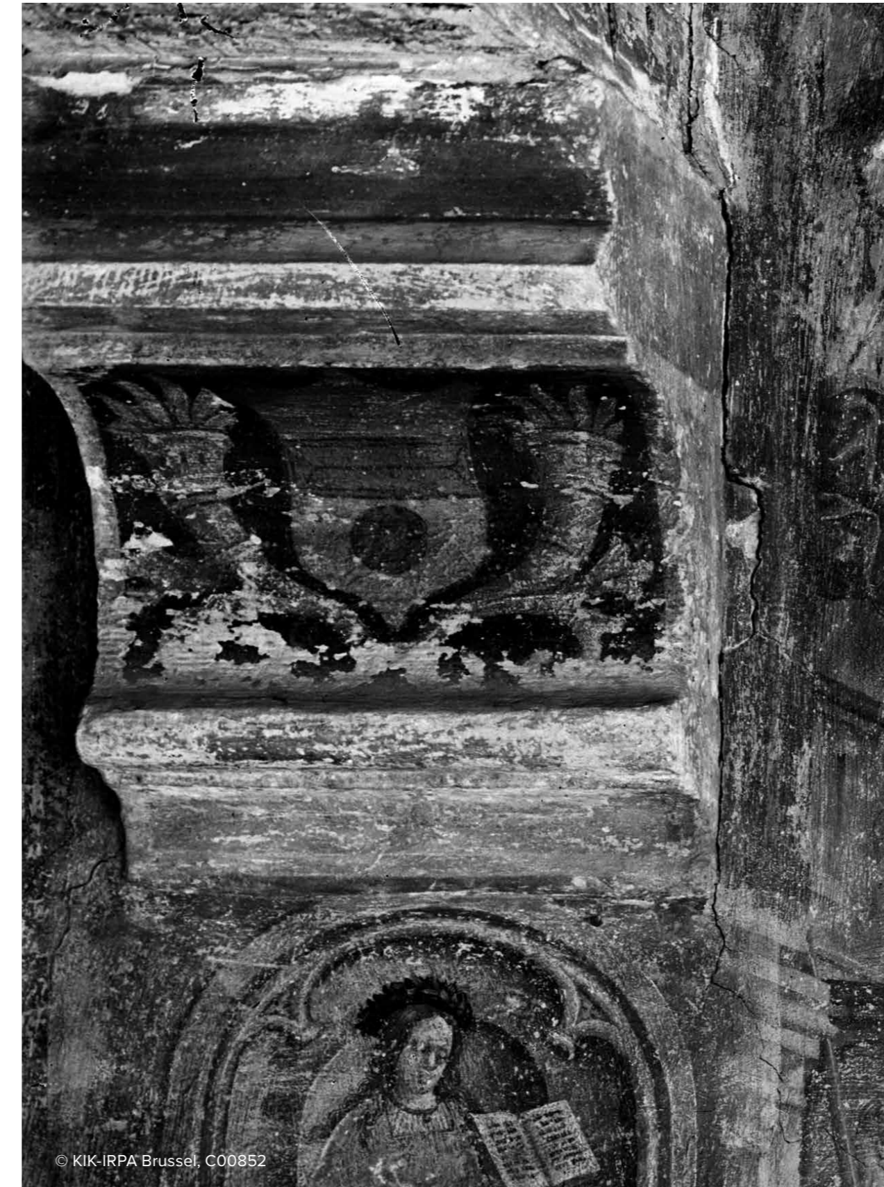
▲ ca.1900, moerbalk oost

Een eerste documentatie van de kwelling van Tantalus gebeurde in 1901 door de kunstschilder Alexandre Hannotiaux (Brussel 1863 – Sint-Jans-Molenbeek 1901) in opdracht van de Belgische staat. Ze zijn waardevol omwille van de documentatie van de kleuren aangezien die in de loop van de 20 ste eeuw verder zijn vervaagd.