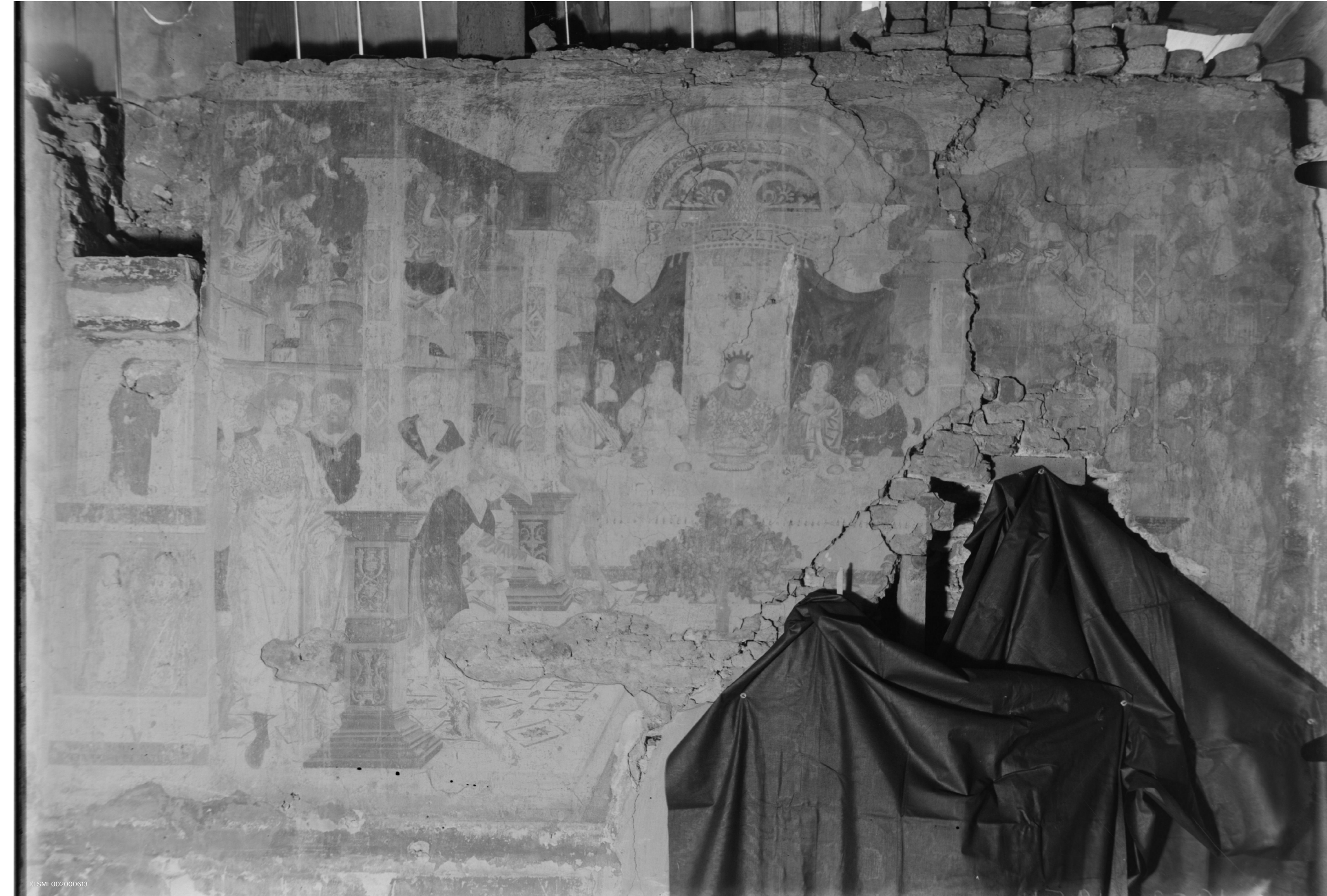
▲ de kwelling van Tantalus , foto C. Joosen 1935. Ten gevolge van de beschietingen van WO I was er ernstige schade aan het interieur van de kamer met de muurschilderingen: de beschilderde kinder- en moerbalken gingen verloren en het linteel boven de toegang aan de noordelijke wand brak door. Hierdoor verdween een groot deel van de schildering.

Omstreeks dezelfde tijd, ca. 1900 werden er drie grote voorstellingen gefotografeerd door Beckers uit Elsene waaronder de kwelling van Tantalus . Deze opnamen dateren van voor de beschieting en de daaropvolgende brand tijdens WO I.