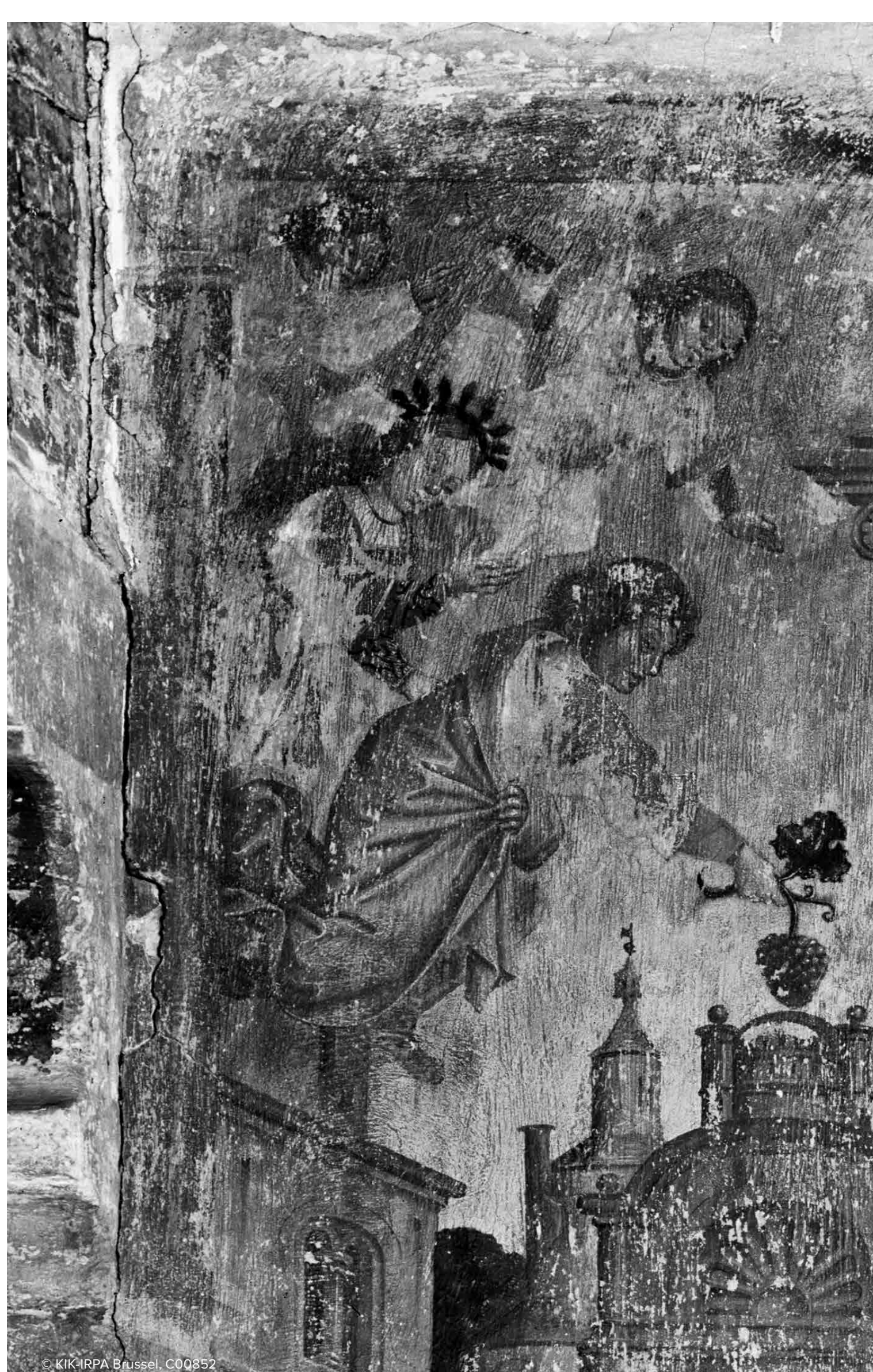
▲, zuidoostelijke hoek. Detail plafond