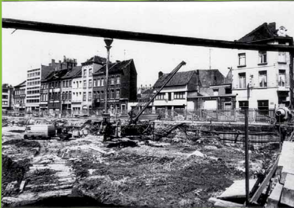
Na afbraak van de overdekte halle op de Botermarkt krijgt men een beeld van gans de straat.