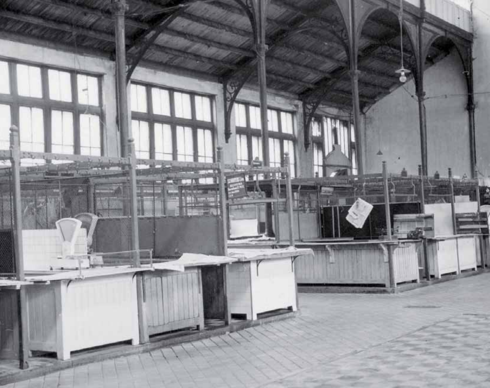
Zicht op de toonbanken en weegschalen in de oude Vleeshal, tussen 1950 en 1958.