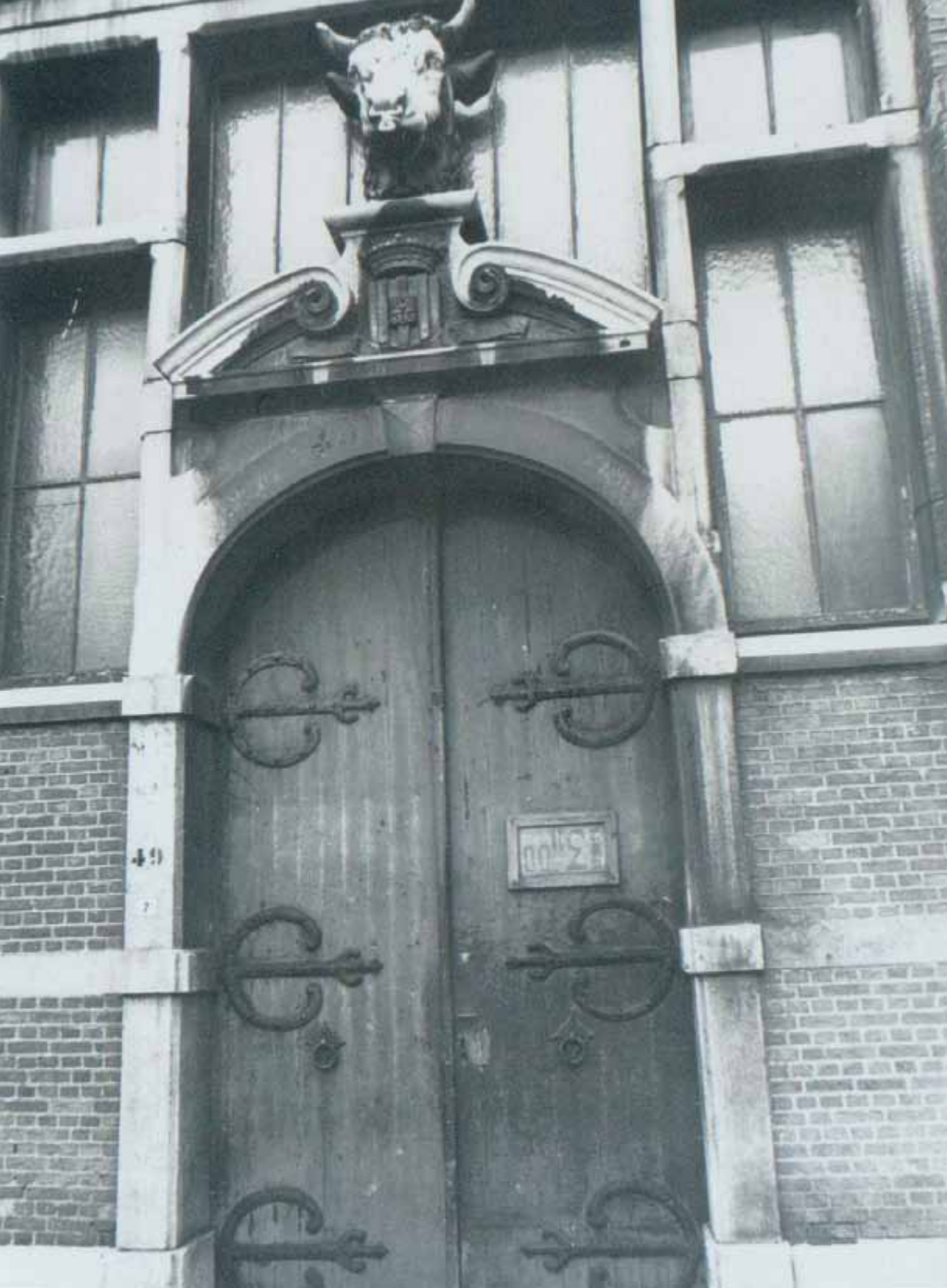
Toegangspoort van de voormalige Stedelijke Vleeshal, 1970