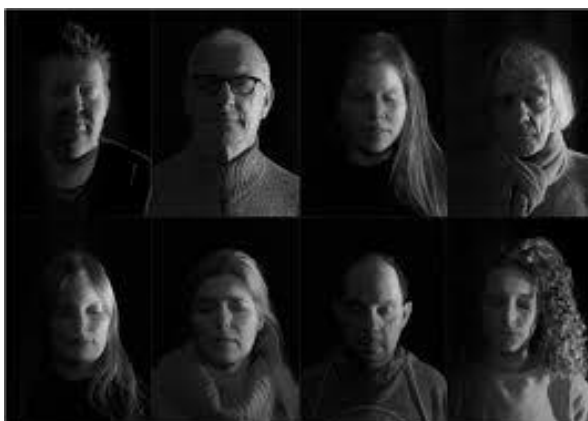
"Toen de goden sliepen" © Sara De Wit

Integrale toegankelijkheid gaat over meer dan kortingen of aangepaste architectuur. Op elk niveau in de cultuursector (professioneel of niet, stedelijk of niet) moet eraan gedacht worden dat elk systeem, elke medewerker, elke presentatievorm denkt aan wie een kwetsbaarheid of beperking heeft. Aanpassingen en coördinatie dringen zich op.