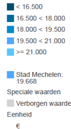
Inkomen per inwoner 2018 - Wijken [13]

➤ Leefbaarheid en veiligheid die onder druk staan en veel verkeersoverlast