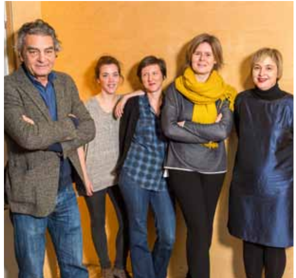
Guido en de ploeg van OP.RECHT.MECHELEN: "Met dit stadsfestival zetten we 2 jaar recht en rechtvaardigheid in de kijker."

Daarom zal OP.RECHT.MECHELEN de komende jaren regelmatig aanwezig zijn in het straatbeeld. Een eerste keer al dit jaar, tussen september en november (zie kader). In het voorjaar van 2017 volgt een inspirerend kunstenfestival. In het voorjaar van 2018 wordt onder andere de opening van het vernieuwde Hof van Busleyden een van de hoogtepunten van het stadsfestival. Heel wat om naar uit te kijken dus!