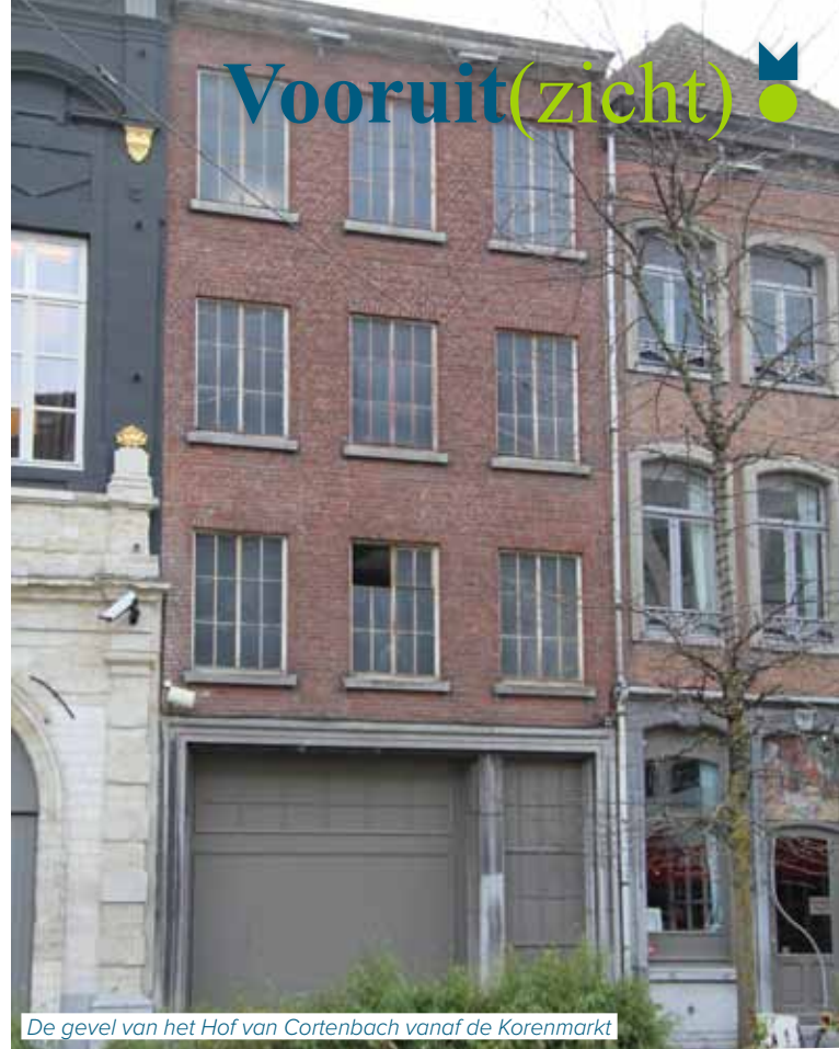
De gevel van het Hof van Cortenbach vanaf de Korenmarkt

Verder koopt en sloopt de stad Ziekeliëdenstraat 1, zodat je de nu nog verborgen tuingevel van het hof kan bewonderen en het binnenplein via die straat kan bereiken. Het Agentschap Ondernemen gaf een subsidie van 482 401 euro aan het project, omdat het de handelskern versterkt. Dat geld gaat naar de aankoop en sloop en een deel van de restauratie van het hof.