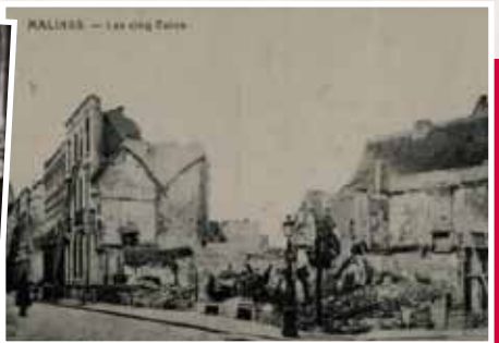
De bombardementen van de Duitse troepen verwoestten vele huizen in de stad.