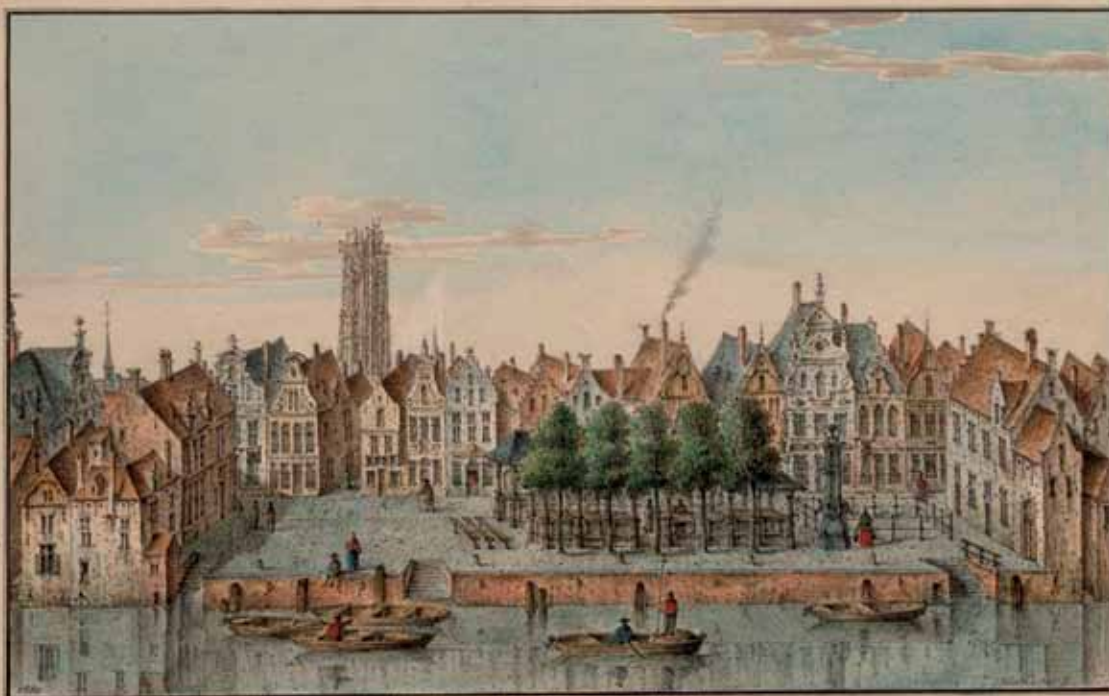
de Vismarkt in de middeleeuwen, de centrale plaats voor vishandel

Wie Mechelen wilde doorvaren, moest tol betalen. Een ketting over de Zenne in Heffen hield wanbetalers tegen.