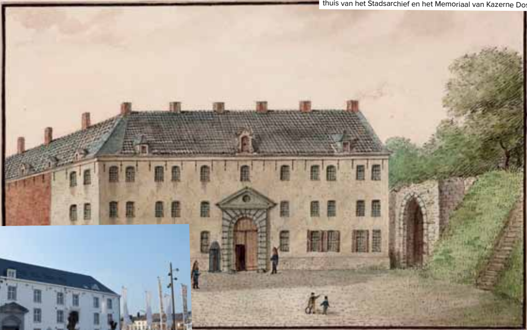
Oorspronkelijk gebouwd als een kazerne voor soldaten, nu de thuis van het Stadsarchief en het Memoriaal van Kazerne Dossin.