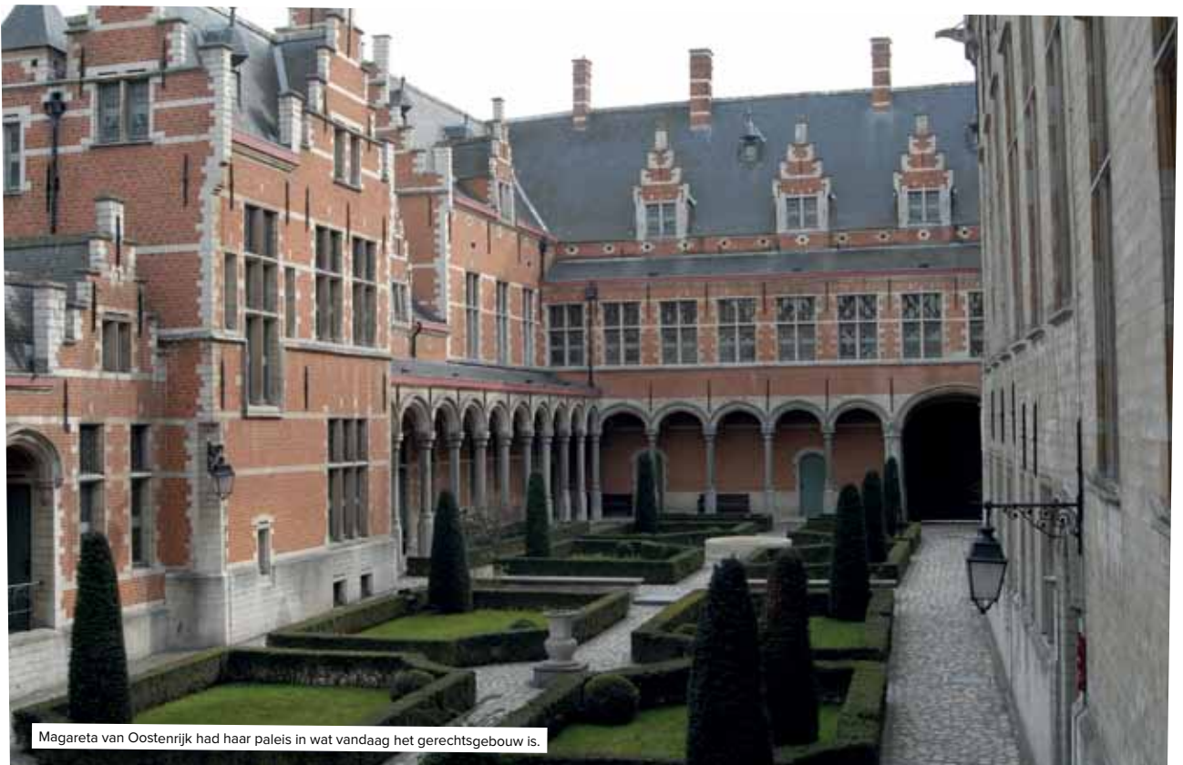
Magareta van Oostenrijk had haar paleis in wat vandaag het gerechtsgebouw is.