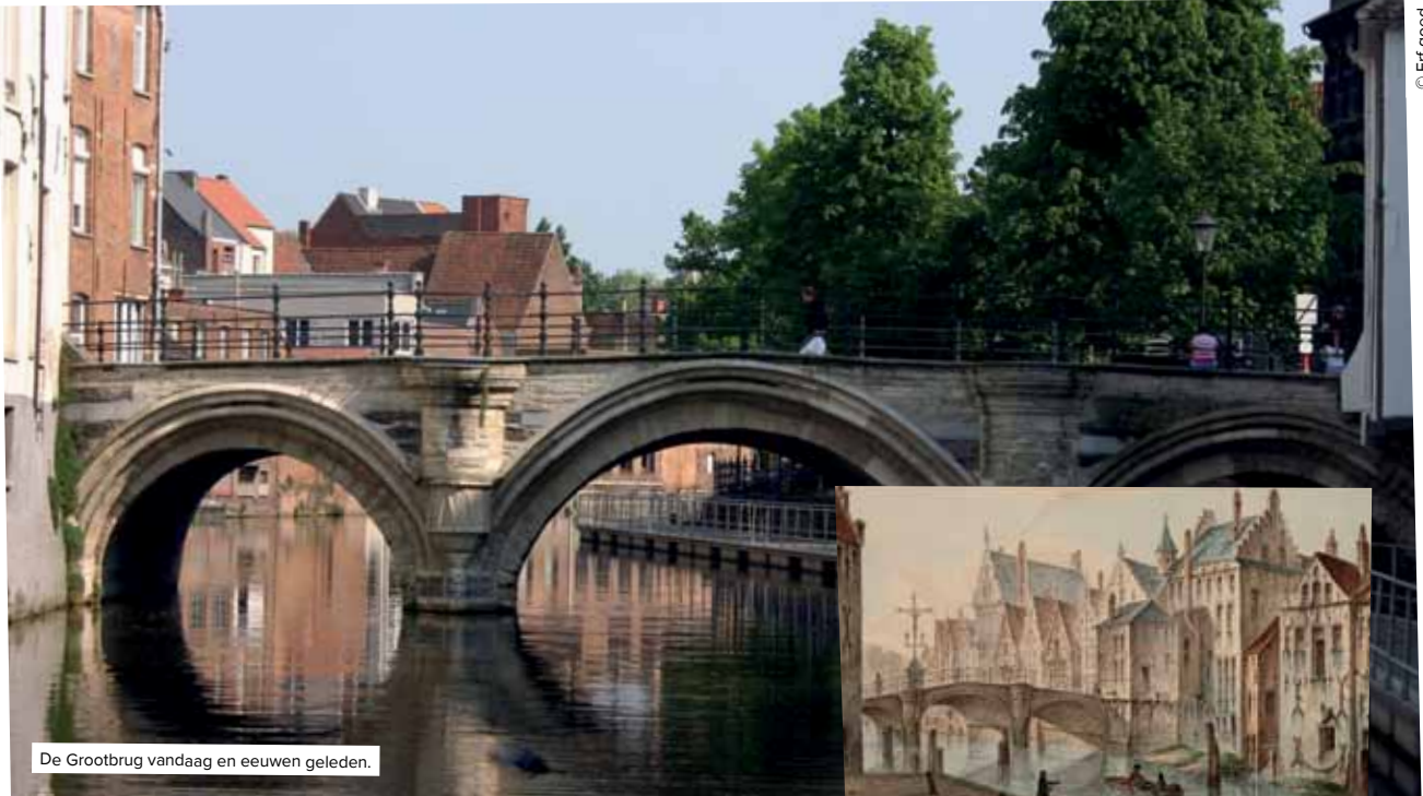
De Grootbrug vandaag en eeuwen geleden.