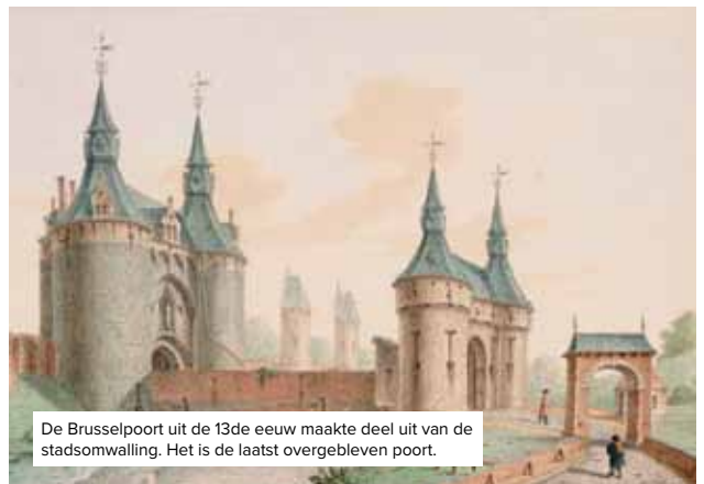
De Brusselpoort uit de 13de eeuw maakte deel uit van de stadsomwalling. Het is de laatst overgebleven poort.

Stadsarchivaris Willy Van de Vijver vertelt er meer over: “Ongeveer 1100 jaar geleden vestigden de eerste Maneblussers zich permanent in wat uitgroeide tot een stadje. Dit gebeurde langs twee kernen: aan een drogere oever - waar vandaag de Korenmarkt ligt - en aan een religieus centrum. Dat laatste groeide uit tot de huidige Sint-Romboutskathedraal.”