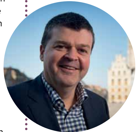
Bart Somers, burgemeester

Met al die verjonging is Mechelen dus meer dan terecht dé kinderstad. Het komt er nu op aan om er samen voor te zorgen dat onze stad aantrekkelijk blijft voor jonge gezinnen.