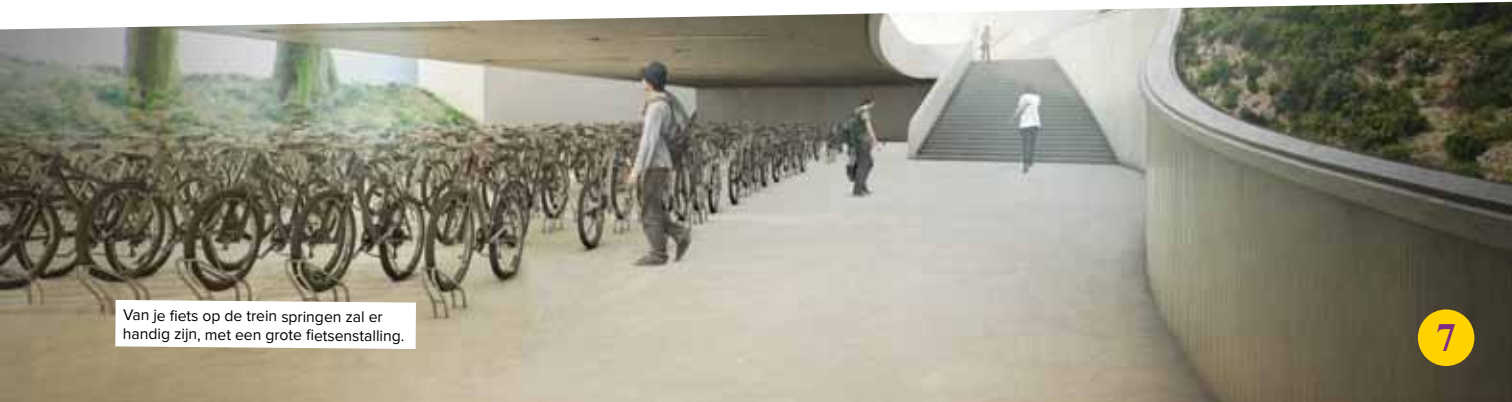
Van je fiets op de trein springen zal er handig zijn, met een grote fietsenstalling.

Wil je op de hoogte blijven van de vorderingen? Schrijf je dan in op de nieuwsbrief door een mailtje te sturen naar mieke@mecheleninbeweging.be .