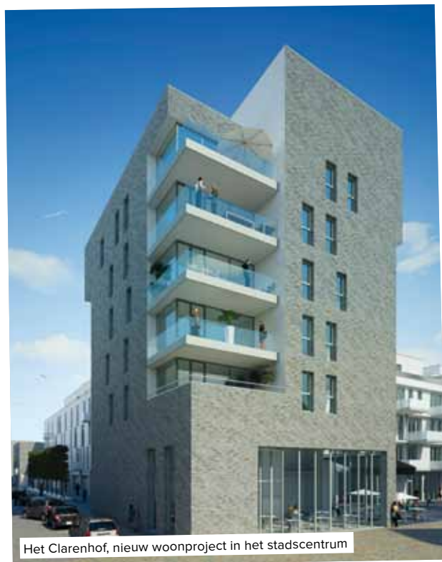
Het Clarenhof, nieuw woonproject in het stadscentrum

Het antwoord van de nieuwe bestuursploeg op deze uitdagingen is glashelder: de stad herkneden op maat van de gezinnen. Mechelen moet nog meer dan vandaag een aangename woonstad zijn. Daarom wil het stadsbestuur werk maken van nieuwe stadsparken en -tuinen, veilige fiets- en voetpaden, autoluwe woonwijken, meer kinderopvang, gezellige winkelstraten en een rijk cultureel en sportief aanbod.