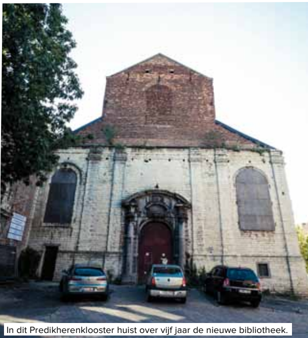
In dit Predikherenklooster huist over vijf jaar de nieuwe bibliotheek.

Het nieuwe stadsbestuur wil niet alleen het bos zien, maar ook de bomen. Het heeft niet enkel oog voor een aantal noodzakelijke en belangrijke projecten voor de hele stad. Elke wijk, elke buurt en elke straat verdient aandacht en zorg.