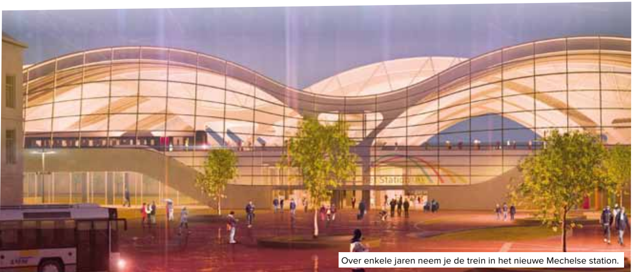
Over enkele jaren neem je de trein in het nieuwe Mechelse station.