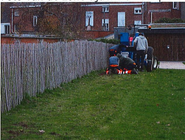
Foto van de zone tijdens de aanplanting van de bolgewassen

Het is echter niet aangewezen om de hondenweide uit te breiden richting de stelconplaten. De zone tussen het hekwerk en het pad met de stelconplaten, is aangeplant met bolgewassen. De bolgewassen zullen dan op termijn verdwijnen als gevolg van de betreding doordat ze in de hondenweide komen te liggen.