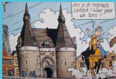
© 2012 Standaard Uitgeverij / WPG Uitgevers België nv

Zelfs in stripverhalen kent onze stad bekendheid. Weet jij uit welke Suske en Wiske deze prent komt? Het antwoord lees je op p. 27.