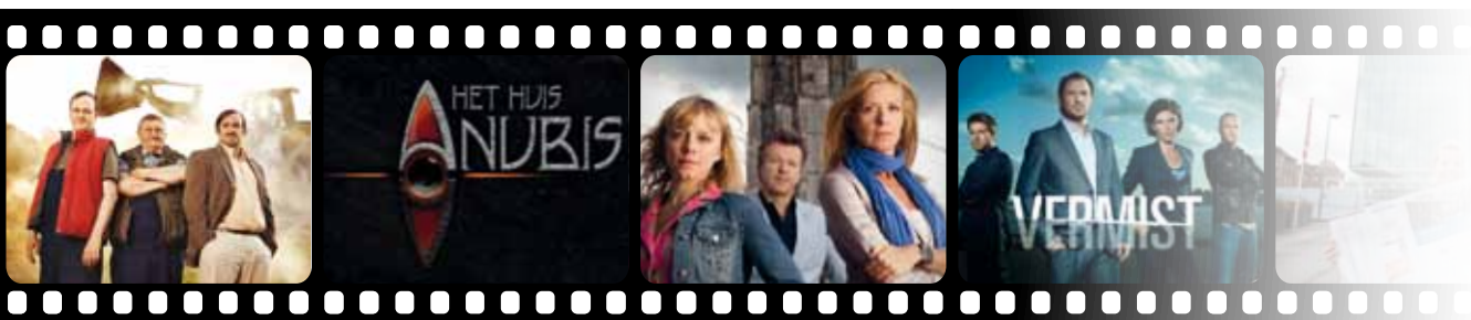
De zonen van Van As (vtm 2011)