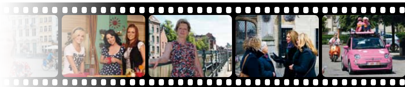
Hallo K3 (vtm Kzoom, 2011)

"Mechelen is klein maar toch stads en even cool en hip als Antwerpen. Verschillende culturen, antieke en moderne gebouwen, woonwijken en bossen ... Mechelen heeft het allemaal. Kijk naar de Grote Markt. Dat is net Brugge. Dat willen we de kijker laten zien. De Mechelaars zullen in Loslopend Wild vast enkele plekjes van hun stad herkennen: de Grote Markt, de Vismarkt, de Haverwerf, het Vrijbroekpark, Stuivenbergvaart, Zandpoortvest ... Zeker kijken dus!", aldus Kelly.