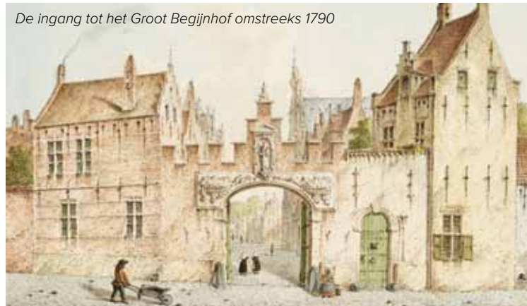
De ingang tot het Groot Begijnhof omstreeks 1790

Maak zeker eens een wandeling door het Klein en Groot Begijnhof. Veel huizen van begijnen zijn bewaard gebleven: één voor één prachtige, eeuwenoude panden. De begijntjes mochten trouwens zelf hun huizen kopen, waardoor ze het konden verbouwen naar eigen smaak. Vandaag zijn er geen begijnen meer in Mechelen. De huizen worden nu bewoond door gezinnen. Zij hebben van de begijnhoven – met o.a. de organisatie van een rommelmarkt – gezellige stadswijken gemaakt. Het zijn net dorpjes in de grote stad.