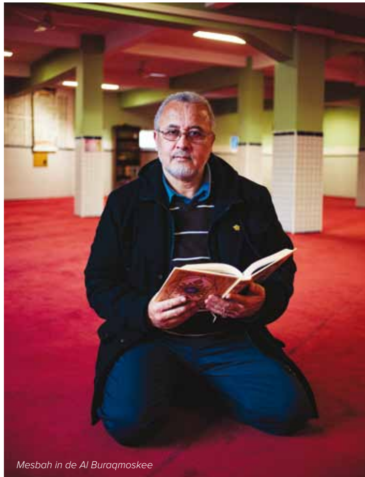
Mesbah in de Al Buraqmoskee