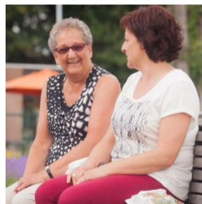
HULP VRAGEN OF GEVEN