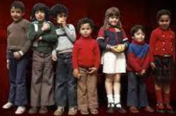
Beeld: De Kinderen van de Migratie