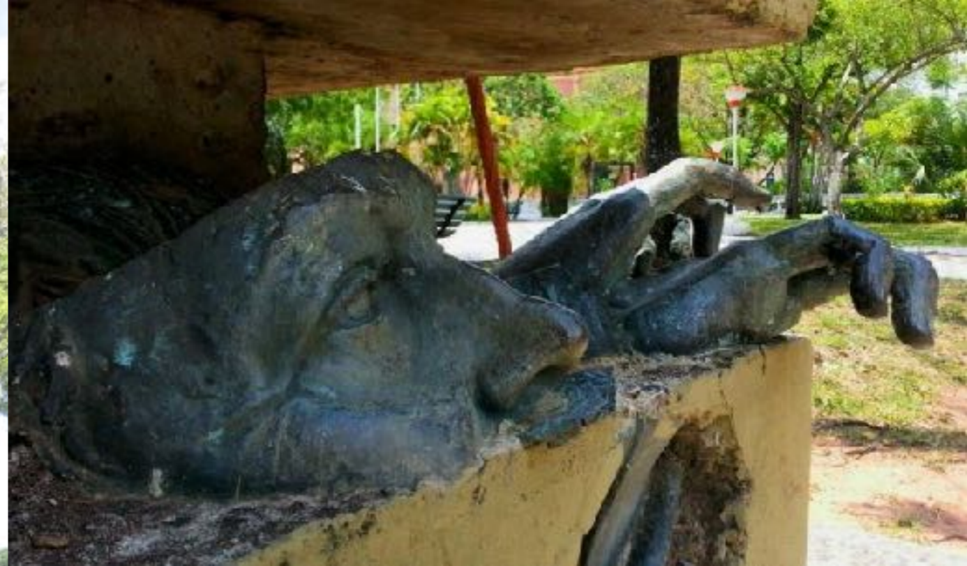
Paraguay - Alfredo Stroessner