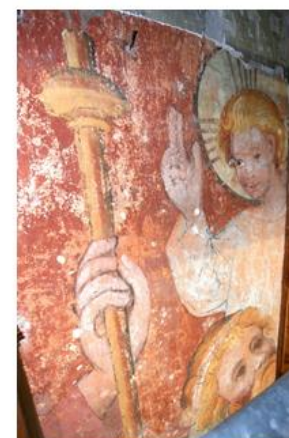
Afb 12: Interieur, muurschildering in de toren