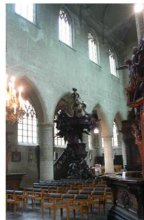
Afb 11: Interieur, zicht op de preekstoel