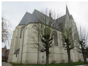
Afb 8: Extérieur, zicht op de noordgevel en koor