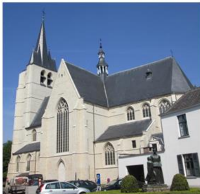
Afb 1: Zuidgevel Sint-Jan Baptistkerk