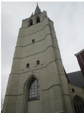
Afb 5: Extérieur, zicht op westgevel en toren