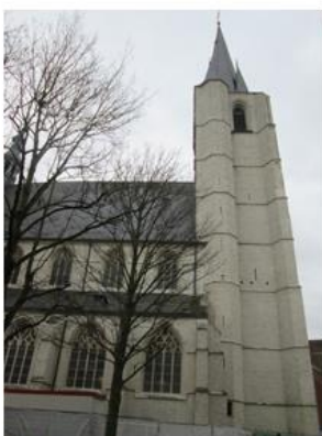
Afb 7: Extérieur, zicht op de toren