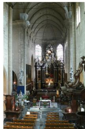
Afb 9: Interieur, zicht op het koor