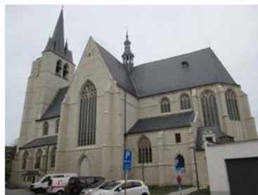
Afb 6: Extérieur, zicht op zuidgevel