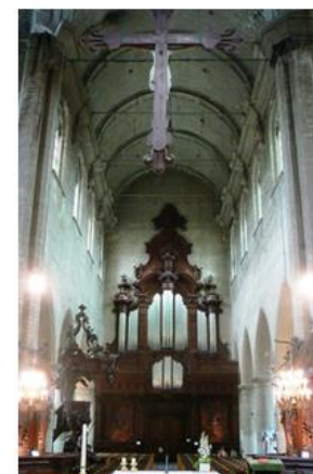
Afb 10: Interieur, zicht van de middenbeuk naar het orgel