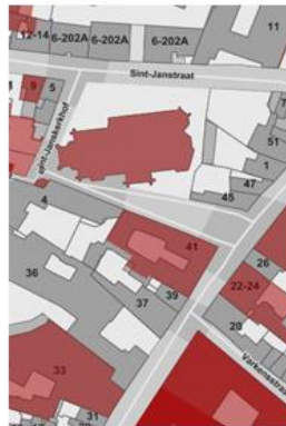
Afb 2: Inplantingsplan Kerk