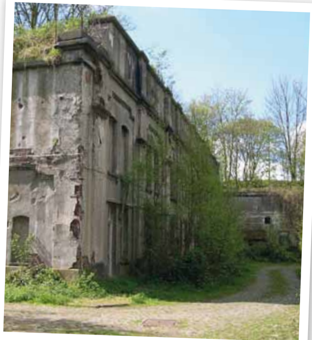
fort van Walem