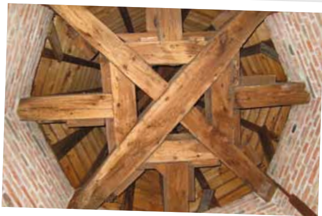
belfortoren: uniek zicht van binnenuit

Tijdens Open Monumentendag heb je voor het eerst de kans om een kijkje te nemen in de belfortoren van het stadhuis (boven de hoofdingang aan de Grote Markt), die helaas nooit werd afgewerkt. Daar ontdek je o.a. de 17de-eeuwse gevangenis . Met tekeningen die de stad er zal tentoonstellen, komt de gevangenis sfeer van toen helemaal tot leven. Een echte ervaring voor wie kennis wil maken met een oude gevangenis en die mooie toren boven het stadhuis.