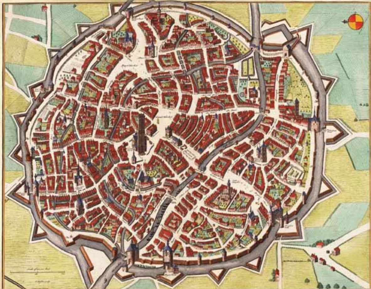
MECHLIN, or MALINES the Capital of one of the ten Provinces of the Netherlands in BRABANT an Archbifhoprick, fituatted upon ȳ DYLE. For Mr Thindal's Continuation of Mr Rapin's History of England

Kijk goed en vind oude vlietjes terug op deze kaart van Mechelen uit 1745.