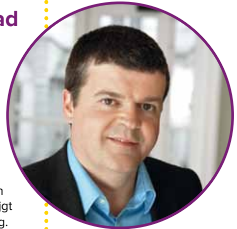
Bart Somers, burgemeester

Jij kan als bewoner helpen om je straat een stukje groener te maken. Al eens gedacht aan een tegeltuintje? Een bloemetje op de vensterbank aan de gevel? De lente is het seizoen bij uitstek om samen met alle Mechelaars werk te maken van een Stad om te zoenen .