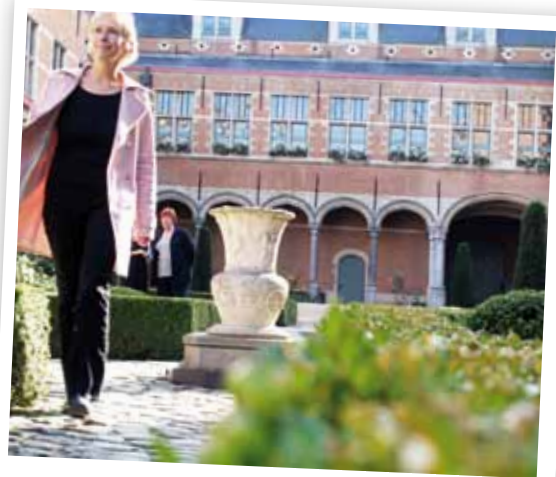
Paleis van Margareta van Oostenrijk

De Sint-Janskerk huisvest een unieke collectie kunstwerken uit de Mechelse gouden jaren. Je vindt er zelfs een schilderij van de beroemde Pieter-Paul Rubens. En tijdens de recente renovatie werden er unieke middeleeuwse muurschilderingen ontdekt. Een bezoekje is een must voor wie van historische kerken houdt.