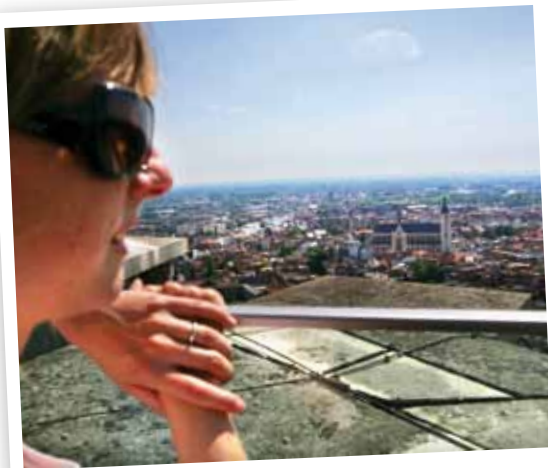
Beklim de toren