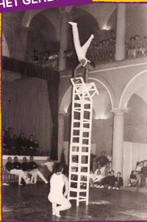
Eén van de ingezonden foto's toont een optreden van KKT Sint-Jozef Coloma uit 1965.