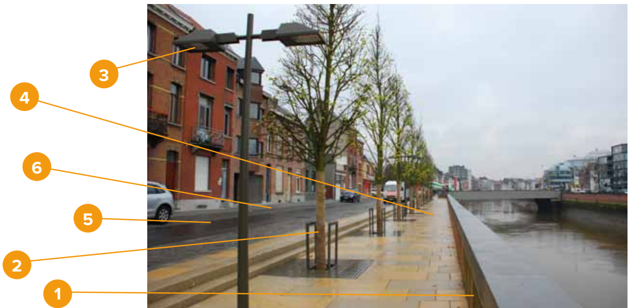
De vernieuwde Keldermansvest is de eerste Mechelse boulevard.

De stad investeert in de renovatie en/of heraanleg van heel wat straten. Je leest hier binnenkort meer over, hou Nieuwe Maan in de gaten.