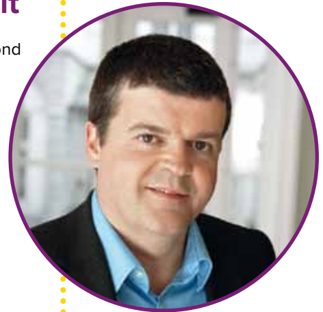
Bart Somers, burgemeester

Ik ben dan ook erg blij dat we de Mechelaars vanaf deze winter veel meer eindejaarsfeer kunnen bieden. Het meest in het oog springend is ongetwijfeld onze nieuwe eigentijdse feestverlichting. Ik denk echt dat we daarmee misschien wel de mooiste feestverlichting van Vlaanderen zullen hebben. Nog een blikvanger wordt het kerstbos op de Grote Markt. Liefst 800 bomen telt dat bos en middenin het Grote Marktbos zetten we een spiegeltent op. En we doen nog veel meer. In deze Nieuwe Maan kom je te weten wat de nieuwe eindejaarscampagne 'Mechelen houdt je warm' nog allemaal inhoudt. Let maar op: Mechelen krijgt eindelijk de eindejaarsfeer die past bij onze mooie stad, verrassend en uitnodigend. Geniet ervan!